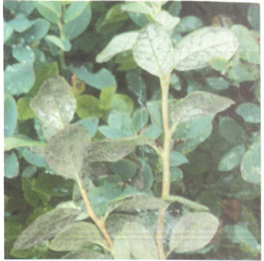
Abb. 2: Exobasidium expansum an Vaccinium uliginosum : auf der Blattunterseite befindet sich zwischen den Blattadern das weiße Hymenium, NSG „Schilfwiese“, 24.7. 2002.