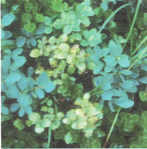
Abb. 1: Exobasidium expansum an Vaccinium uliginosum : befallene Rauschbeer-Pflanzen mit gelbgrünen Blattoberseiten, NSG „Schilfwiese“, 24.7. 2002.

- expansum NANNF. an Vaccinium uliginosum L. Erz.: 5443/12 zwischen Geyer und Elterlein, moorige Stelle süd- östlich des Krebsloches, ca. 650 m ü. M., 5.7. und 23. 8.