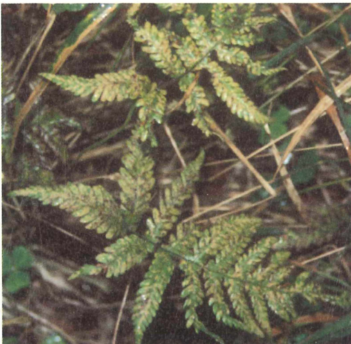
Abb. 8: Uredienbefallsbild von Uredinopsis filicina an Phegopteris connectilis : NSG „Taufichtig“, 25.8. 1998.