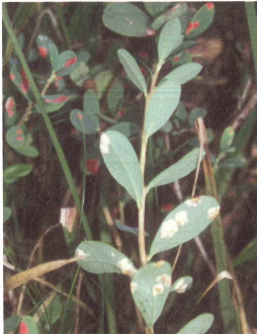
Abb. 3: Exobasidium pachysporum an Vaccinium uliginosum : NSG „Moor an der Roten Pfütze“, 26.7. 2002.