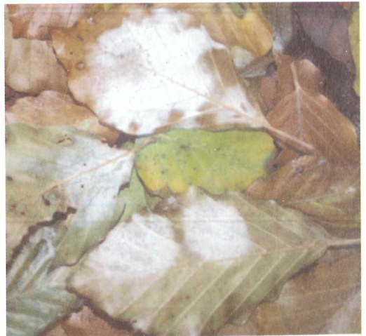
Abb. 7: Phyllactinia guttata, persistentes Mycel auf Fagus -Blättern: Berg Bärenstein, 31.10. 2003.

- fulva SYD. an Lathyrus pratensis L. Erz.: 5443/12 NSG „Moor an der Roten Pfütze“, 650 m ü. M., 26.5. 2002.