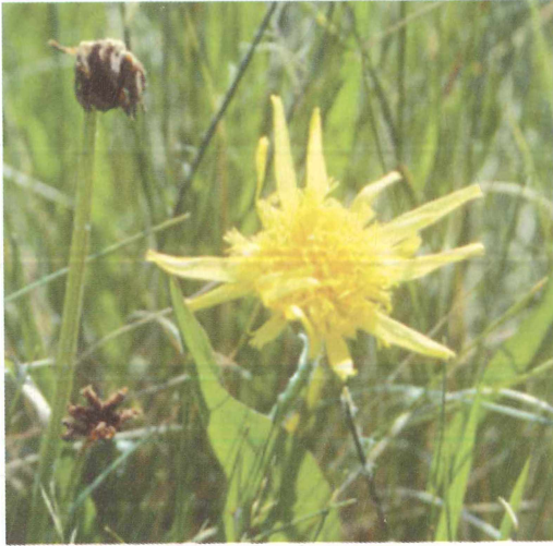
Abb. 5: Microbotryum scorzonerae in den Blütenkörben von Scorzonera humilis : zwischen Elterlein und Hermannsdorf, 4.6. 2003.

- arenariae (BERK.) TUL. an Moehringia trinervia (L.) CLAIRV. Erz.: 5244/34 Scharfenstein, Zschopau-Aue, 350 m ü. M., 24.4. 2000. 5343/34 ca. 2 km südwestlich Geyer, nahe Großer Fuchsstein, 690 m ü. M., 7.6. 2004. 5344/34 zwischen Paradiesmühle und Schloss Hohenwendel, 470 m ü. M., 15.4. 2000. 5443/23 Schlettauer Teichgebiet, 580 m ü. M., 7.11. 2004. 5444/11 bei Annaberg-Buchholz, Weißgut, 520 m ü. M., 25.5. 1999. 5543/21 bei Crottendorf, nahe ehemaliger Kalkbruch, ca. 800 m ü. M., 21.5. 1998. Vgt.: 5539/41 ca. 500 m südwestlich Taltitz, Uferregion Talssperre Pirk, 400 m ü. M., 23.10. 2004. 5839/2 bei Schönberg, SW-Hang Kapellenberg, 700 m ü. M., 23.10.2004.