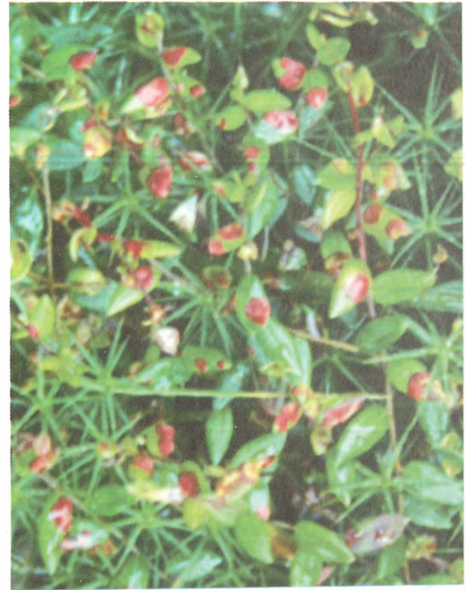
Abb. 4: Exobasidium rostrupii an Vaccinium oxycoccus : NSG „Moor an der Roten Pfütze“, 26.7. 2002.