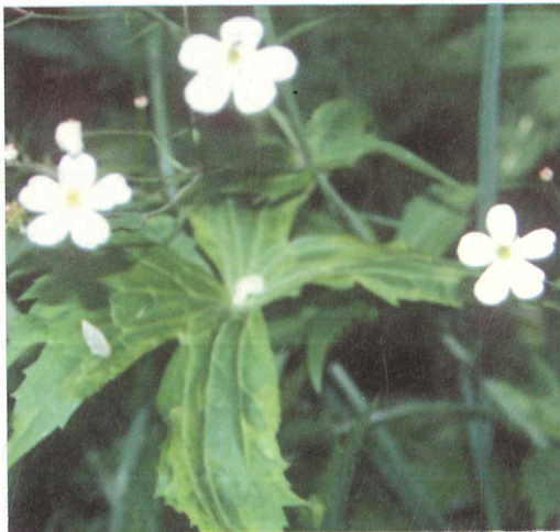
Abb. 6: Befallsbild von Peronospora alpicola auf Blatt von Ranunculus platanifolius : NSG „Zechengrund“, 28.6. 2004.