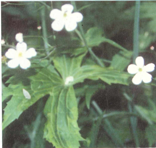
Abb. 6: Befallsbild von Peronospora alpicola auf Blatt von Ranunculus platanifolius : NSG „Zechengrund“, 28.6. 2004.