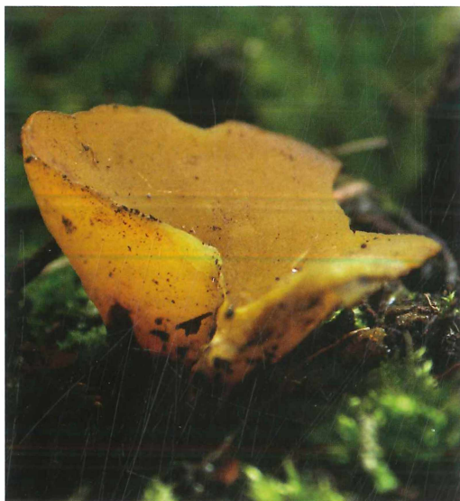
Abb. 1: Sowerbyella fagicola (Buchen-Wurzelbecherling) am 20.12.2014 bei Schloss Reinhardsbrunn, MTB 5129/1.