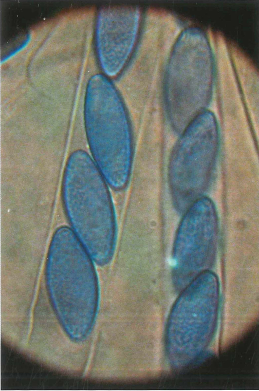
Abb. 2: Sowerbyella fagicola . – Feinwarzige Ascosporen mit Baumwollblau im Immersionsobjektiv.