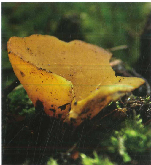
Abb. 1: Sowerbyella fagicola (Buchen-Wurzelbecherling) am 20.12.2014 bei Schloss Reinhardsbrunn, MTB 5129/1.