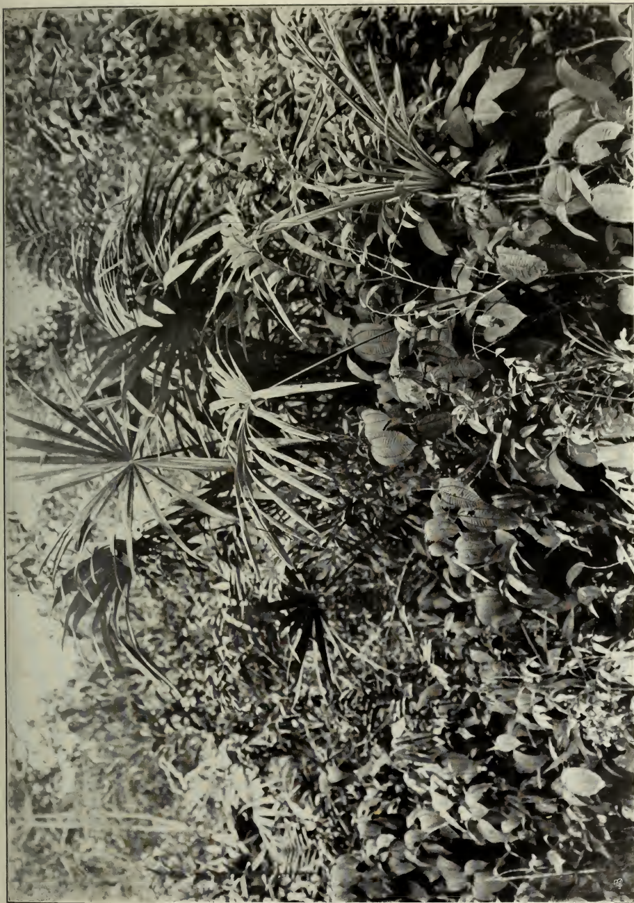
Unterholz im Walde, auf Sandboden bei Manáos, mit Carludorica sp., Miconia Schuackii Cogn. und Mabea sp.