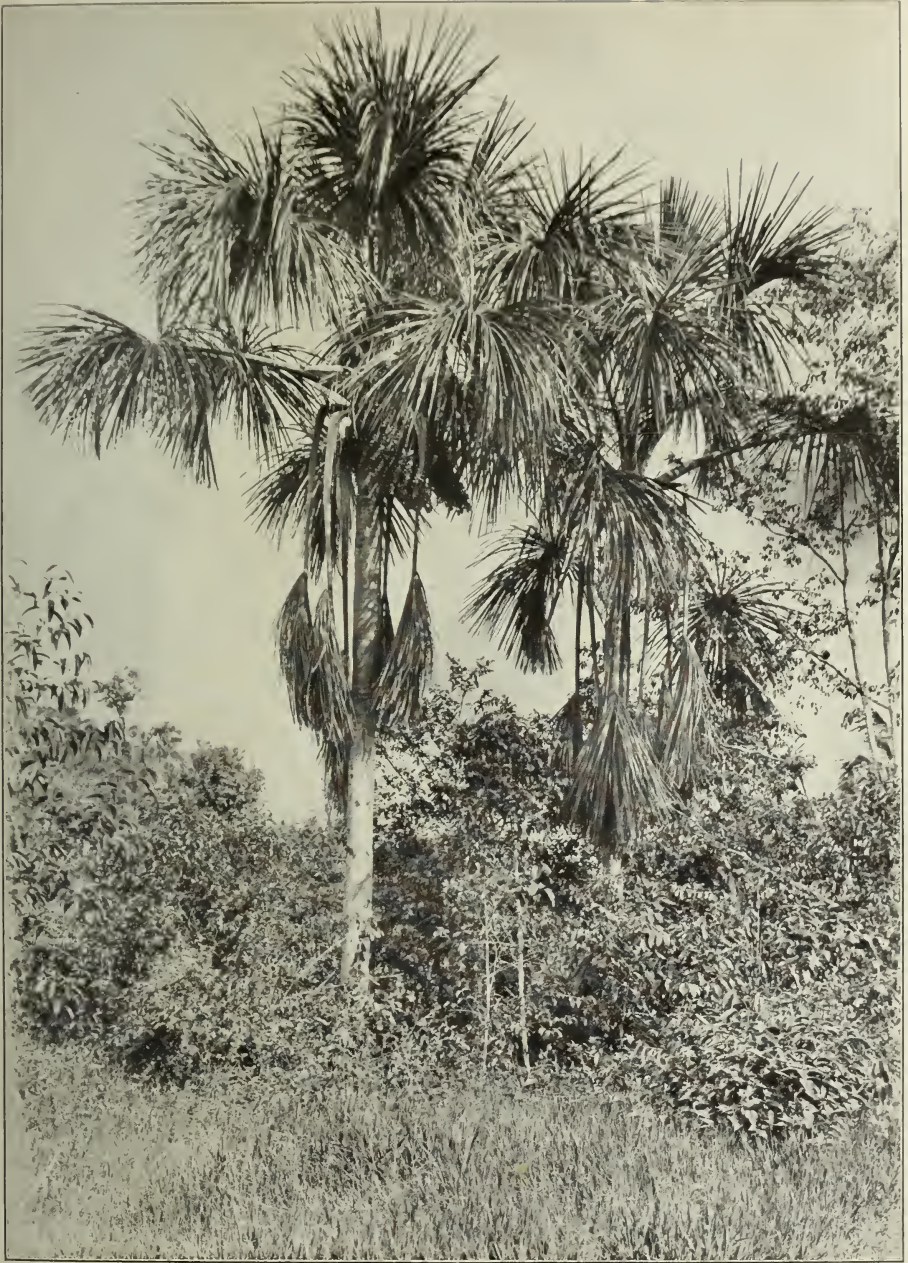
Mauritia flexuosa L. f. bei Manáos.