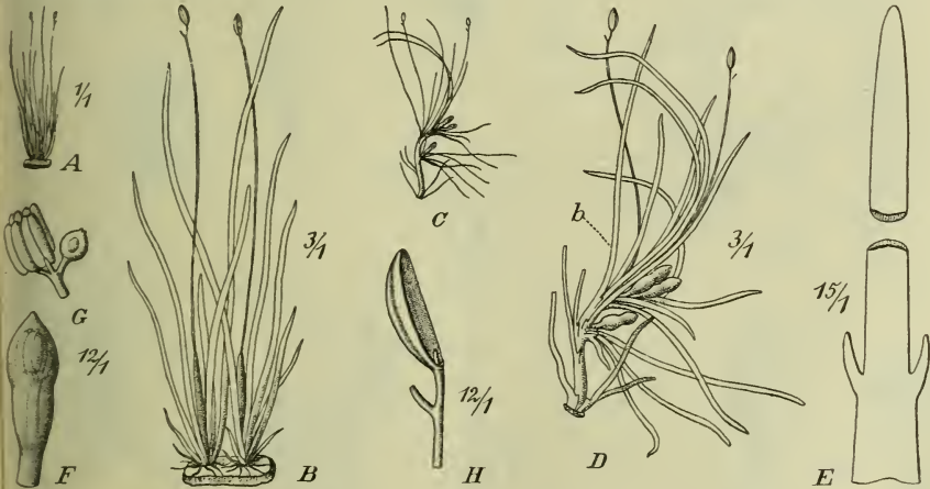
Fig. 4. Ledermanniella linearifolia Engl. A, B Unverzweigte Sprosse, C, D verzweigter Sproß, E das Blatt b dieses Sproßes vergr., F Spathella geschlossen, G sehr junge Blüte, H stehen bleibende 5-nervige Klappe der Frucht.

L. linearifolia Engl. n. sp.; turiones simplices vel parce ramosi. Folia angustissime linearia, ea ad basin ramulorum supra basin breviter bidentata. Spathella clausa claviformis breviter apiculata. Pedicellus valde elongatus folia aequans. Tepala? Staminum filamenta quam antherae plus duplo breviora. Pistillum breviter stipitatum. Capsula inaequaliter bivalvis, valva persistente late oblonga, naviculiformi, 5-nervia. — Fig. 4.