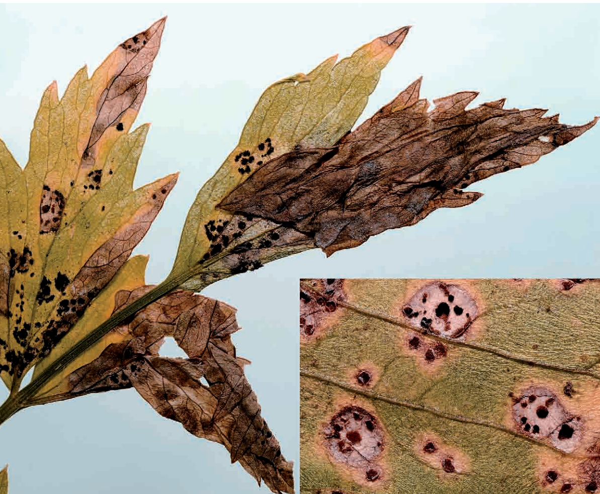
Abb. 1: Puccinia bornmuelleri , Rostpilzlager auf dem Liebstöckel: Uredinien und Telien.

Da die befallenen Gewürzpflanzen nicht mehr verwendbar sind, kann dieser Rostpilz vor allem in Hausgärten am in Kärnten so beliebten „Lustock“ durchaus größeren Schaden anrichten.