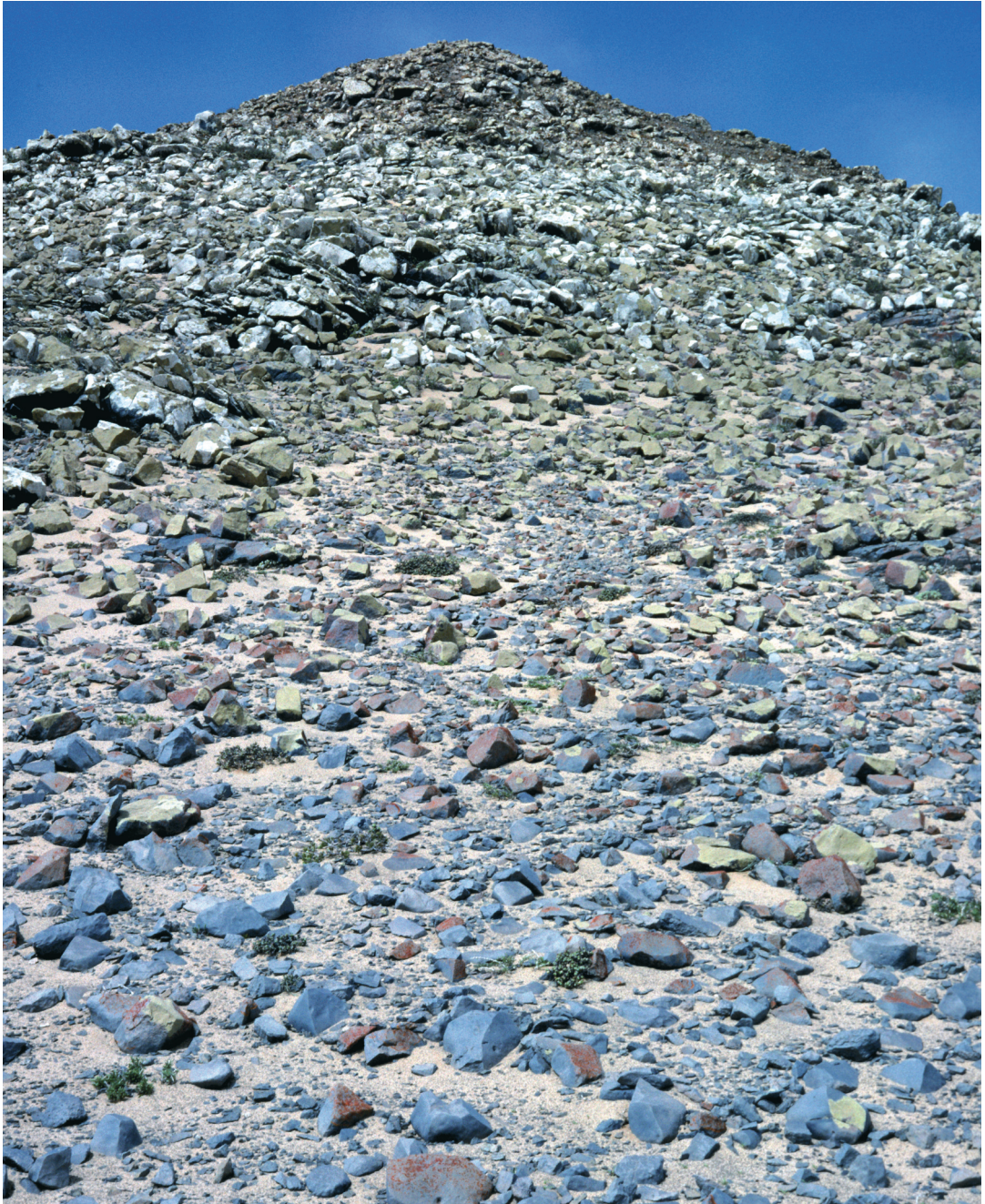
Abbildung 3: Von Doleritsteinen bedeckter Hang mit optisch unterscheidbaren Flechtenzonen aufgrund der Dominanz verschiedener Arten im hygrischen Gradienten: (1) Ausgedehnte Caloplaca elegantissima -Zone im Bereich Hangbasis und Mittellhang mit spärlicher Deckung von C. elegantissima (rot); es dominiert die bläuliche Eigenfarbe des Gesteins. – Darüber (2) schmale Lecanora substylosa -Zone. – Darüber (3) weiße Lecanora panis-erucae -Zone. – Bergkuppe (4) Teloschistes -Zone (orange). Hügelzüge SE Cap Cross.