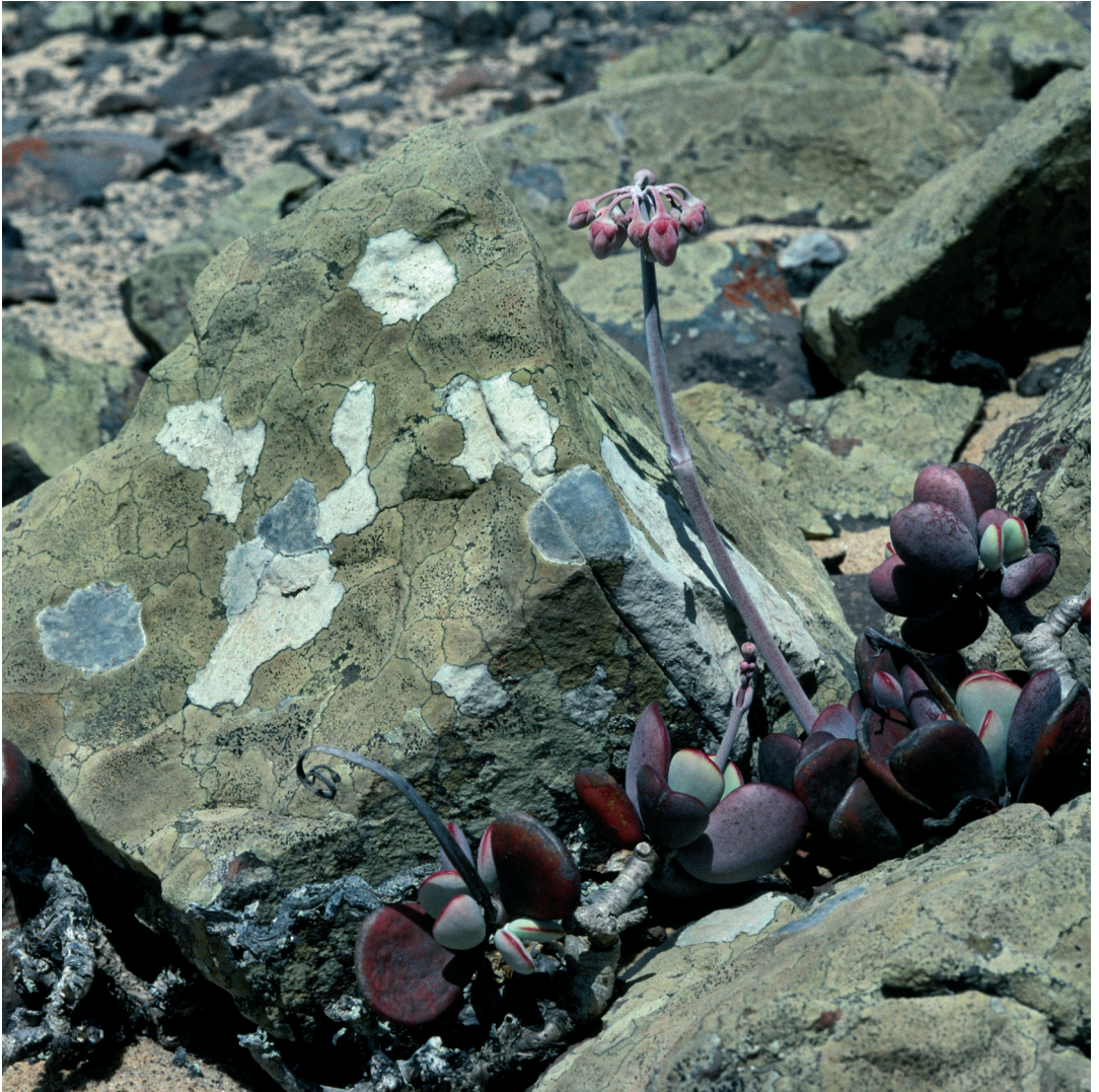
Abbildung 4: Steine im Bereich der Lecanora substylosa -Zone (Nähe Transekt A), mit L. substylosa (gelblich), L. panis-erucaae (weiß), Diploschistes diploschistoides (grau) und der Blattsukkulente Cotyledon orbiculata .