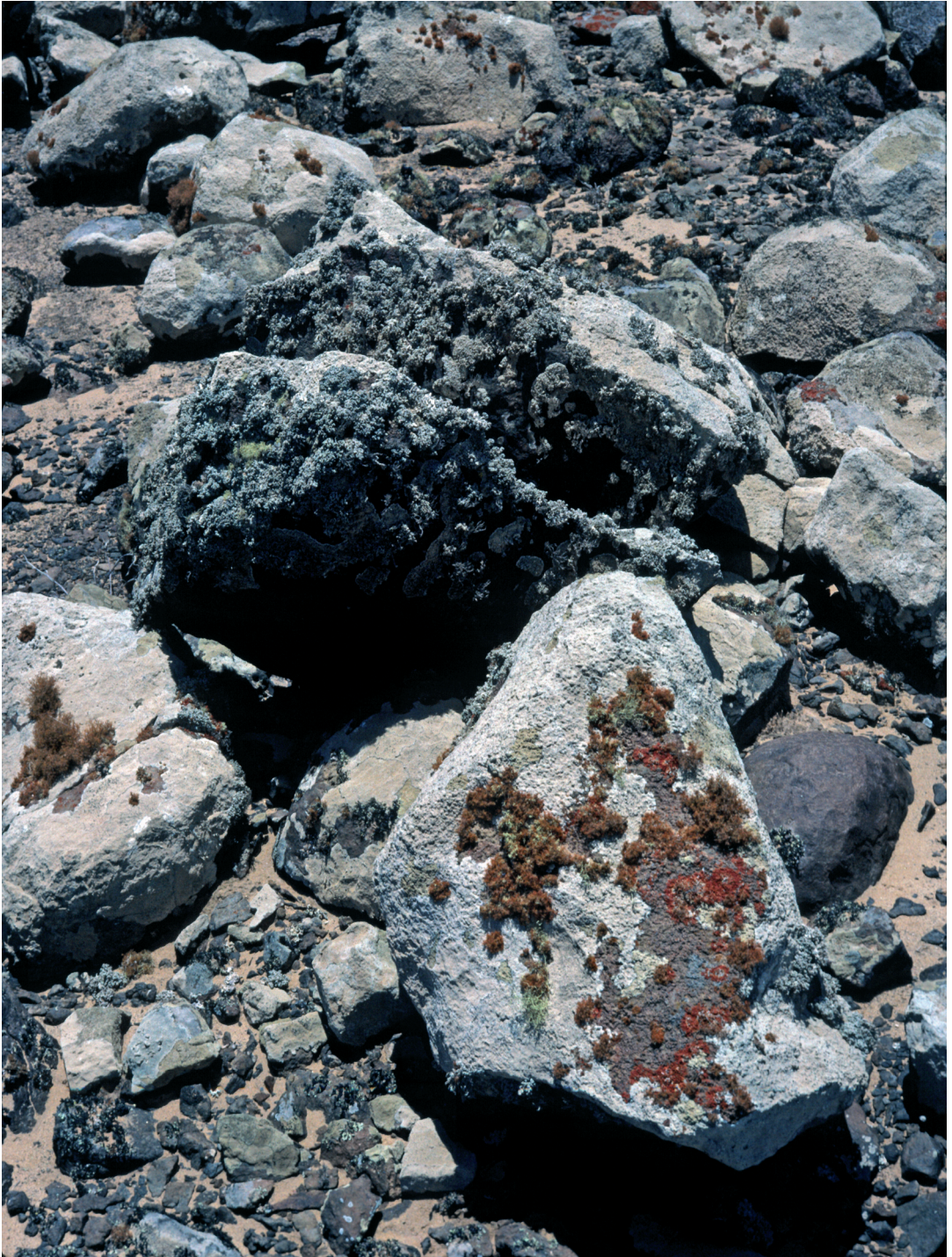
Abbildung 5: Lecanora panis-erucae -Zone, mit Xanthoria turbinata (rot) und Teloschistes capensis (orange).