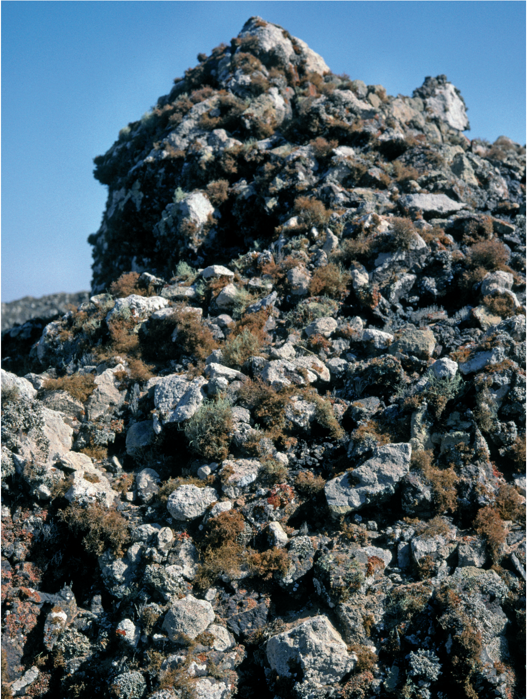
Abbildung 6: Teloschistes -Zone üppigster Ausprägung (Nähe Transekt B).