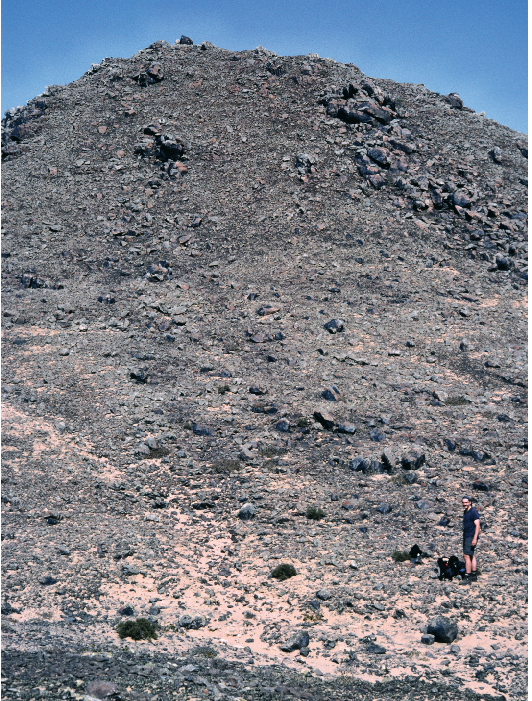
Abbildung 2. Beginn (N-Hang) des Transektes C, von ganz rechts unten zur Spitze des Hügels verlaufend.