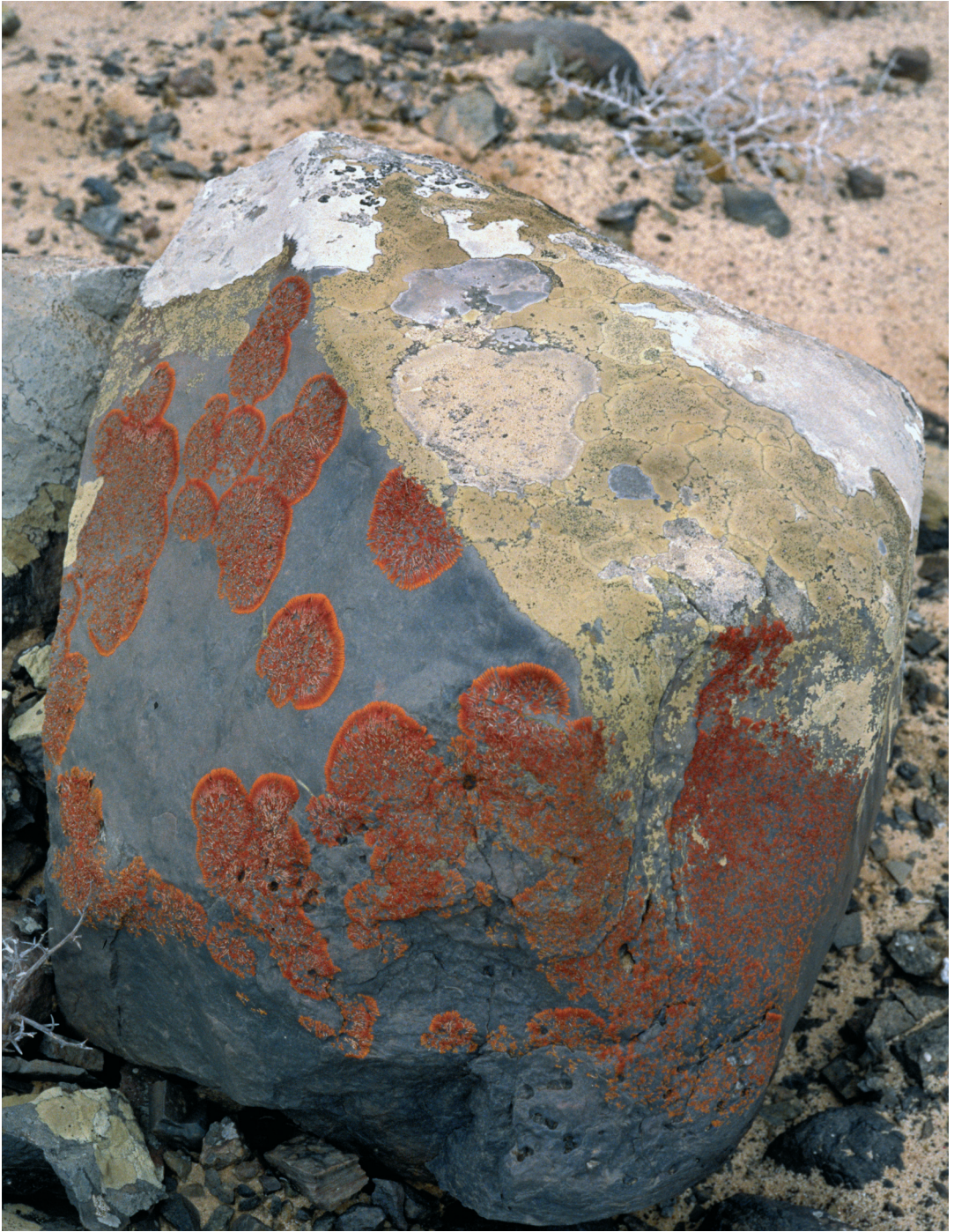
Abbildung 7: Doleritblock mit ausgeprägtem Luv-/Lee-Bewuchs: In Nebelzug-Lee Caloplaca elegantissima (rot), in Luv Lecanora substylosa und Lecanora panis-erucae .