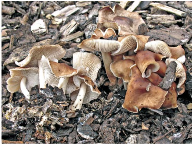
a) Der Üppige Rübling Collybia luxurians in einem Vorgarten in der Albsiedlung am 30.6.2007. Die Art stammt aus Nordamerika.

Exotische Pilze auf Holzhäcksel und Rindenmulch.