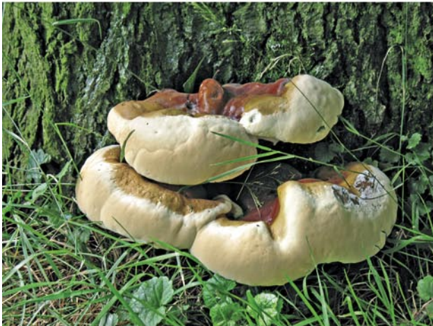
b) Häufig dient die nordamerikanische Rot-eiche ( Quercus rubra) als Substrat oder Mykorrhiza-Partner. Das Bild zeigt den Harzigen Lackporling ( Ganoderma resinaceum) auf einem alten noch lebenden Baum in Grünwinkel am 24.7.2007.