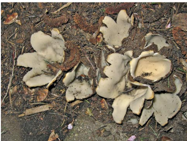
c) Eine Mykorrhiza-Symbiose mit Zedern bildet der Zedern-Becherling Geopora sumneriana , der aus Nordafrika eingewandert ist (Absiedlung, 4.5.2005).