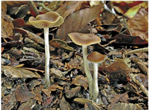
b) Der Blaufärbende Kahlkopf Psilocybe cyanescens, der seit 1960 aus Karlsruhe bekannt ist, stammt vermutlich auch aus Nordamerika (Schlosspark, 20.10.2008).