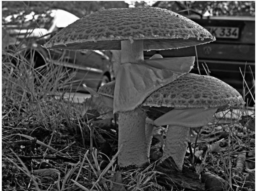
Abbildung 2. Der Braunschuppige Riesen-Egerling Agaricus augustus, hier am 22.8.2005 an einem Parkplatz nahe der Universitätsmensa, ist eine von zehn Agaricus -Arten, die im urbanen Karlsruhe beobachtet wurden.