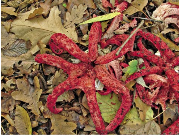
a) Der Tintenfischpilz ( Clathrus archeri) stammt aus Australien und wurde erstmals 1940 in Karlsruhe beobachtet. Das Bild zeigt die Art im Schlossgarten am 25.10.2001.