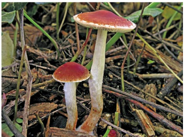
c) Ebenso im Schlosspark findet man den vermutlich aus Australien stammenden Orangeroten Träuschling Stropharia aurantiaca (3.11.2008). Die Art ist seit 1998 aus Karlsruhe bekannt.