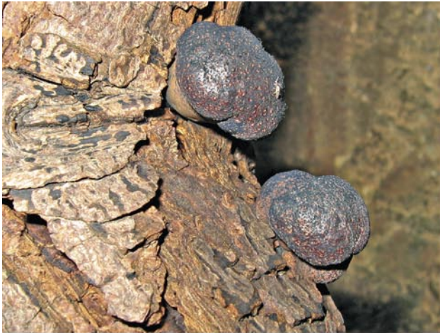
Synanthrope heimische Pilze in Gebäuden

a) In einem Krötenterrarium im Vivarium des Naturkundemuseums fruktifizierte der Kugelpilz Daldinia childiae (14.7.2005). – Foto: M. SCHOLLER.