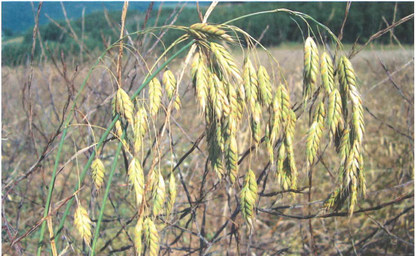
Abb. 2: Infloreszenz von B. grossus im FFH-Gebiet „Ackerflur bei Ulmet“

Die landwirtschaftliche Nutzung besteht in einer Fruchtfolge von Winterraps, Winterweizen und Sommerweizen, gelegentlich wird Grünland eingeschoben, wobei unterschiedliche betriebsspezifische Abfolgen bezüglich des Anbaus der einzelnen Fruchtarten zu finden sind. Zwar gilt B. grossus als spezifischer Begleiter von Dinkelkulturen, wie HÜGIN (2008) jedoch darlegte, ist die Dicke Trespe nicht an Dinkelkulturen gebunden. In allen ackerbaulichen Kulturen des Untersuchungsgebietes wurden bis zum Beginn intensiver Schutzmaßnahmen regelmäßig und flächendeckend Herbizide sowohl gegen dikotyle als auch gegen monokotyle unerwünschte Begleitpflanzen eingesetzt, so dass diese fast nur noch am Feldrand zu finden waren. Dieses galt vor allem für B. grossus , von dem ebenfalls nur wenige Exemplare an Feldrändern standen. Es wird vermutet, dass die Dicke Trespe nie ausgestorben war und das Gebiet bereits in Zeiten extensiver Nutzung vor der allgemeinen Herbizidanwendung besiedelt hatte. An Feldrändern überlebte sie die landwirtschaftliche Intensivierung, bis Fördermaßnahmen einsetzten und sie wieder Zugang auf die eigentlichen Ackerflächen fand.