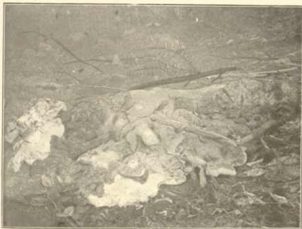
a) Polyporus montanus Quél.

An den Wurzeln der großen Tanne bei Bayr. Eisenstein; überwächst Holzteile und Preiselbeeren. Vorn (weißer länglicher Fleck) ein Stück abgeschnitten, um das Fleisch und die Porenschicht zu zeigen. (Naturaufnahme des Verf.)