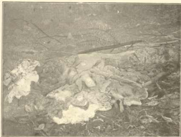
a) Polyporus montanus Quél.

An den Wurzeln der großen Tanne bei Bayr. Eisenstein; überwächst Holzteile und Preiselbeeren. Vorn (weißer länglicher Fleck) ein Stück abgeschnitten, um das Fleisch und die Porenschicht zu zeigen.