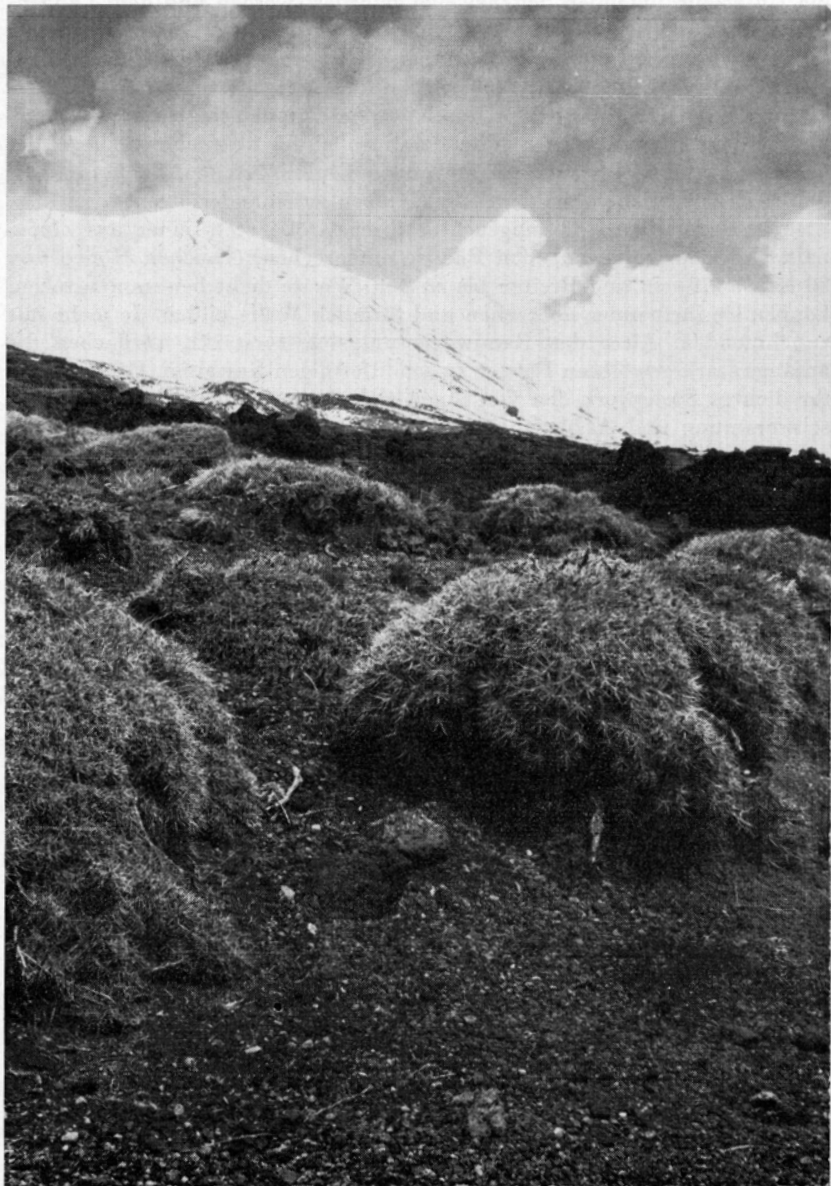
Fig. 1. Dorntragant- ( Astragalus siculus -) Polsterboden auf der Vulkan-Hochsteppe des Ätna in etwa 1850 m Höhe. Im Hintergrund die schneebedeckte Montagnola (2644 m). — 23. April 1963.