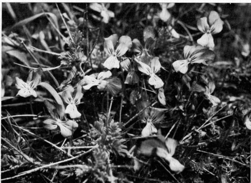
Fig. 6. Blaßviolette Blüten des Ätna-Veilchens ( Viola aetnensis ) zwischen den Rhachisdornen des Sizilischen Dorntragants; etwa \frac{1}{1} nat. Gr. — 23. April 1963.