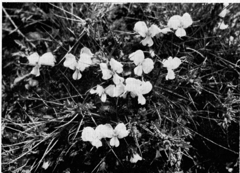
Fig. 7. Gelblichweiße Blüten des Ätna-Veilchens ( Viola aetnensis ) zwischen den Rhachisdornen des Sizilischen Dorntragants; etwa \frac{1}{1} nat. Gr. — 23. April 1963.