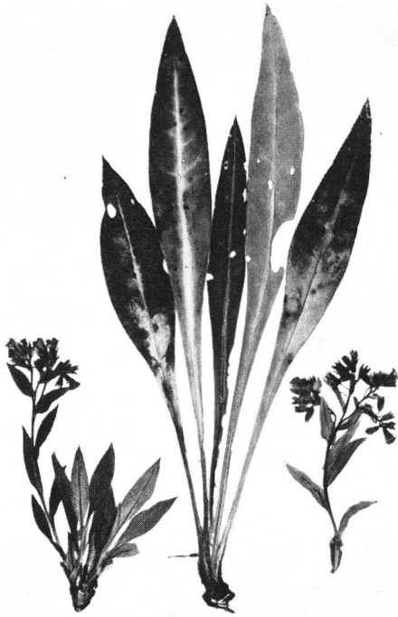
Abb. 1. Pulmonaria angustifolia von Stetten bei Karlstadt in Unterfranken. Herbarexemplare.