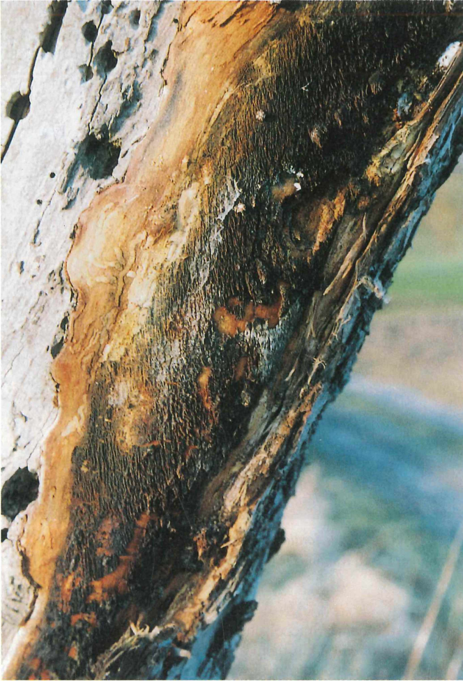
Abb. 7. Gelber oder Krustenförmiger Apfelbaum-Stachelschwamm, Sarcodontia crocea , an altem Apfelbaum in 1,5 m Höhe am Kernholz wachsend. Links Brutfraß vom Großen Apfelbaum-Splintkäfer ( Scolytes mali ) Kreis Altenburger Land, Monstab, MTB 5040/11 ; 10. Februar 2000.

Der erste belegte Nachweis aus dem Landkreis Altenburger Land befindet sich im Herbarium HAUSKNECHT der Friedrich-Schiller-Universität Jena (JE). Der Pilz wurde 1982 bei Langenleuba-Niederhain an Malus domestica erfaßt.