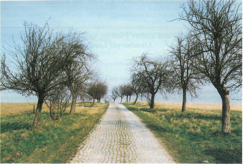
Abb. 1. Eine der wenigen noch existierenden Apfelbaumalleen

Zwischen Gösau und Grünberg an der Landesgrenze von Sachsen in den Landkreis Altenburger Land, MTB 5140/3; 26. März 2000.