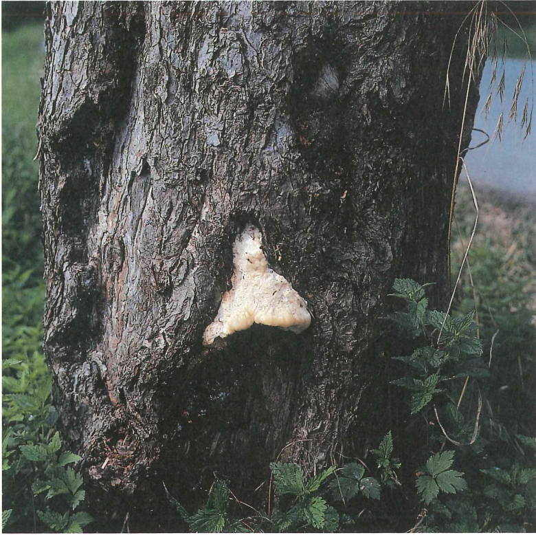
Abb. 3. Tyromyces fissilis , Apfelbaum-Weichporling

Sachsen, Geithain, Sommerfeld, Tongrube, MTB 4942/13, 220 m NN, 25. Juli 1997 an Malus domestica (Straßenbaum).