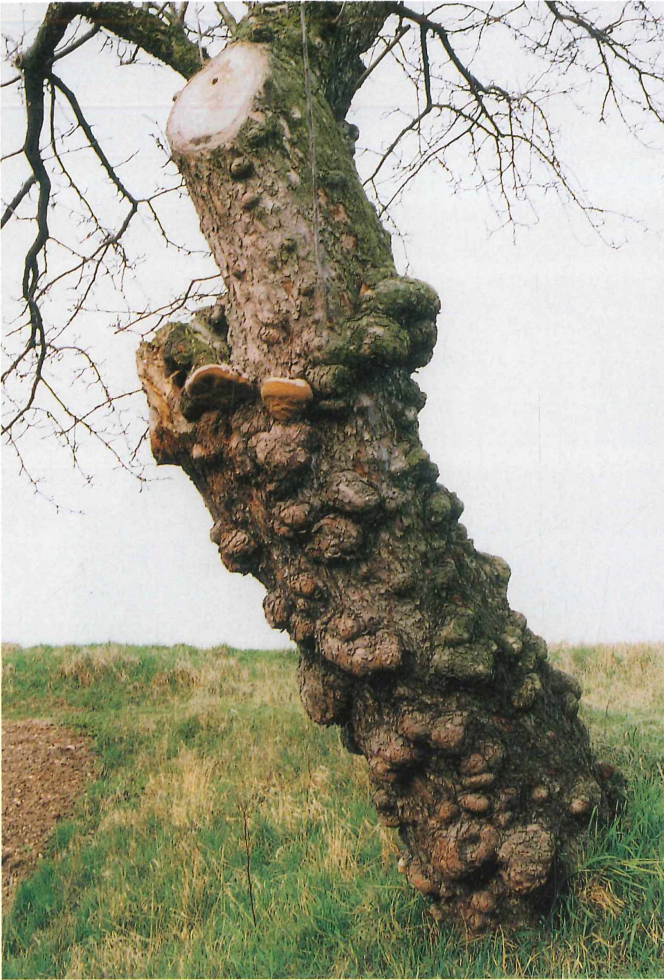
Abb. 5. Alter knorriger Apfelbaum mit Apfelbaum-Feuerschwamm, Phellinus alni Kreis Altenburger Land, Sommeritz, MTB 5140/11 ; 26. März 2000.

unterscheiden. Mehrjährige, konsolenförmige, sehr harte und schwere Fruchtkörper von Phellinus igniarius sensu lato 7) kommen an verschiedenen Baumarten, insbesondere an Weiden, im Landkreis vor. Die im landwirtschaftlich geprägten Umfeld der Dörfer an Malus wachsenden Fruchtkörper werden als Apfelbaum-Feuerschwämme, Phellinus alni (BONDARZEW) PARMASO, bezeichnet (Abb. 5). Feuerschwämme, die an Erle ( Alnus ), Hainbuche ( Carpinus ), Hasel ( Corylus ), Kirsche, Pflaume, Schlehe ( Prunus ) und Eberesche ( Sorbus ) wachsen (vgl. FUCHS & HILGARTNER 1995, KRIEGLSTEINER 1999, KRIEGLSTEINER 2000), gehören nach jetziger Kenntnis zu Phellinus alni . Im Landkreis ist der Apfelbaum-Feuerschwamm gegenwärtig ein selten vorkommender holzabbauender Großpilz.