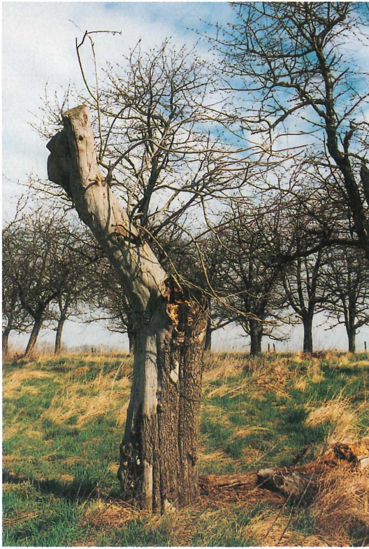
Abb. 2. Apfelbaumruine mit Spechthöhle und Befall durch Sarcodontia crocea . Wichtig für den Erhalt seltener und geschützter Insekten, z. B. Rosenkäfer ( Protaetia lugubris )

Kreis Altenburger Land, Göllnitz, Streuobstwiese MTB 5039/42; 248 m NN; 2. April 2000.