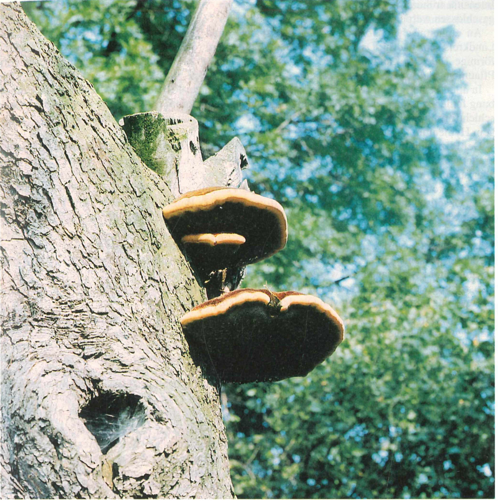
Abb. 6. Zottiger Schillerporling, Inonotus hispidus Osthüringen, Kleinbernsdorf, MTB 5137/4; 9. April 1992.

nen Bäumen, daß sich der Pilz der Beobachtung fast gänzlich entzieht. Besonders durch Stürme – es genügt aber auch schon Wind – werden die winzigen Sporen weit verbreitet und finden in Baumwunden (die z. B. durch Baumschnitt entstehen) ein keimfähiges Substrat. Sie keimen aus und bilden Fruchtkörper, meistens wieder im Kronenbereich, mitunter auch am Stamm. Die gelbbraunen, filzigen Fruchtkörper scheiden im Herbst opalisierende Tropfen an der Unterseite des Hymeniums aus. Gegenwärtig kommt der Pilz zerstreut im gesamten Kreisgebiet an alten, verletzten Apfelbäumen vor. Ein früherer Fund wurde unter der Bezeichnung Polyporus hispidus BULL. (Fleischigzottiger Porling) bereits von SCHWEPFINGER et al. (1934) erwähnt. Die Autoren notierten: „An lebenden Laubstämmen, besonders an Apfel- und Birnenbäumen. Rositz“. In den Arbeiten von JUNG (1960, 1963) wird der Porling nicht erwähnt, und in denen HOFMANN'S (1967, 1972, 1989, 1993) existiert nur der Hinweis zum Vorkommen des Pilzes am Keplerplatz in Altenburg. Dort hatte JUNG den Pilz im Mai 1963 an Platane registriert und dokumentiert.