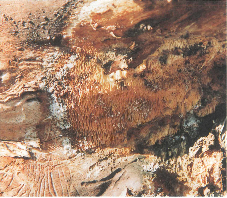
Abb. 8. Sarcodontia crocea am Apfelbaum bei Kaimnitz

Kreis Altenburger Land, Kaimnitz, MTB 5040/14; 7. Februar 2000.