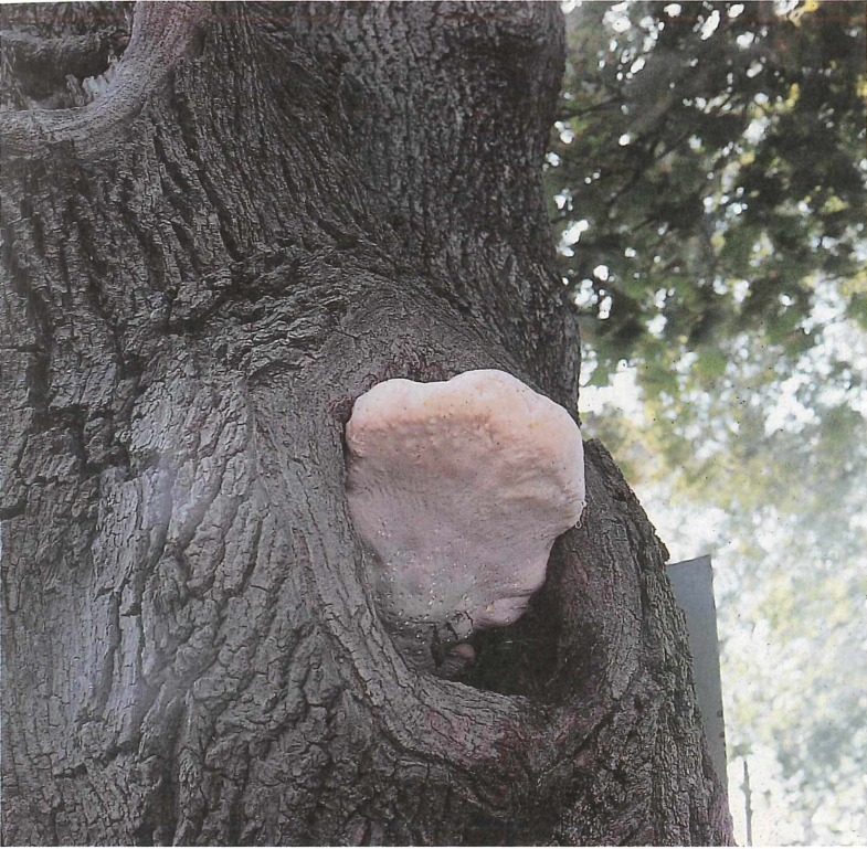
Abb. 4. Spongipellis spumeus , Laubholz-Schwammporling

Sachsen-Anhalt, Zörbig, MTB 4338/4, 26. November 1983, an Acer pseudoplatanus .