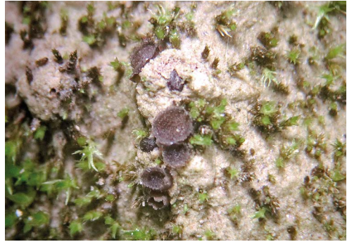
Abb. 1 – Selenaspora guernisacii -Apothecien, Standortfoto; Foto: I. Rössl Abb. 2 – Selenaspora guernisacii -Apothecien, Standortfoto; Foto: I. Rössl