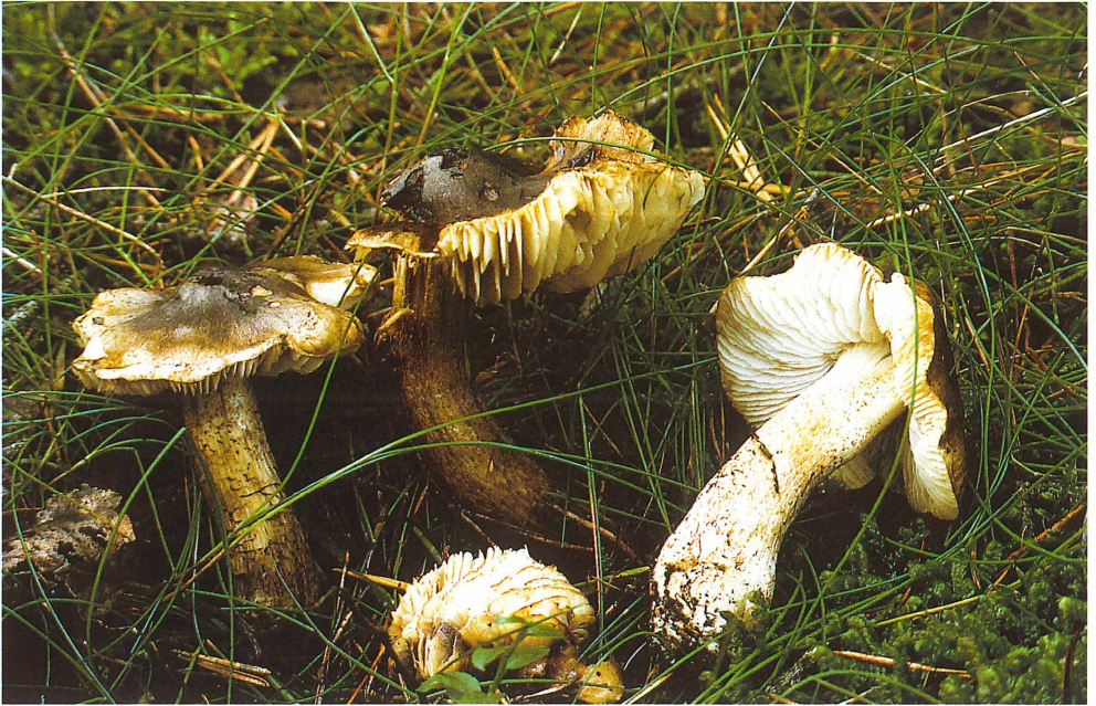
Abb. 4: Tricholoma subglobisporum , 15.08.1985, MTB 6439/1, Lückenrieth