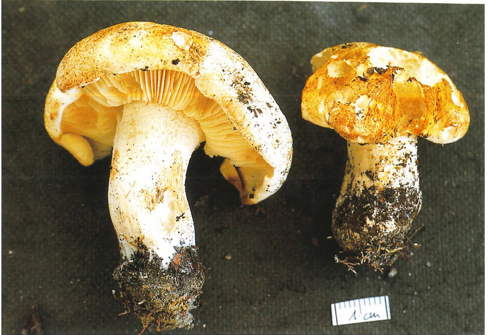
Abb. 2: Tricholoma luteovirens , 08.09.2002, MTB 6739/13, Spitalhaus