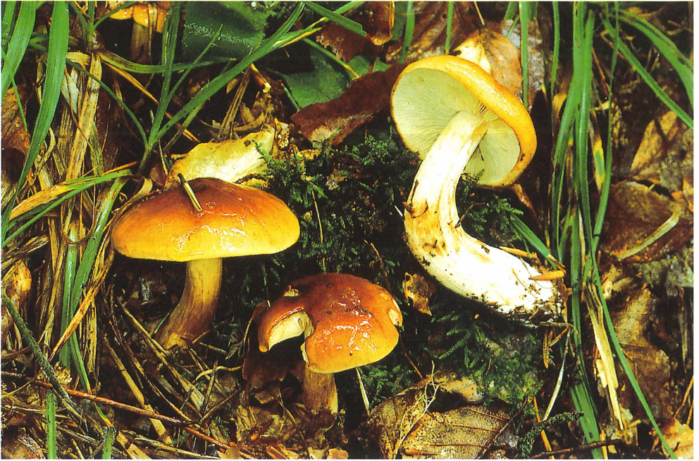
Abb. 5: Tricholoma ustaloides , 05.08.1993, MTB 6439/3, Gnötzendorf