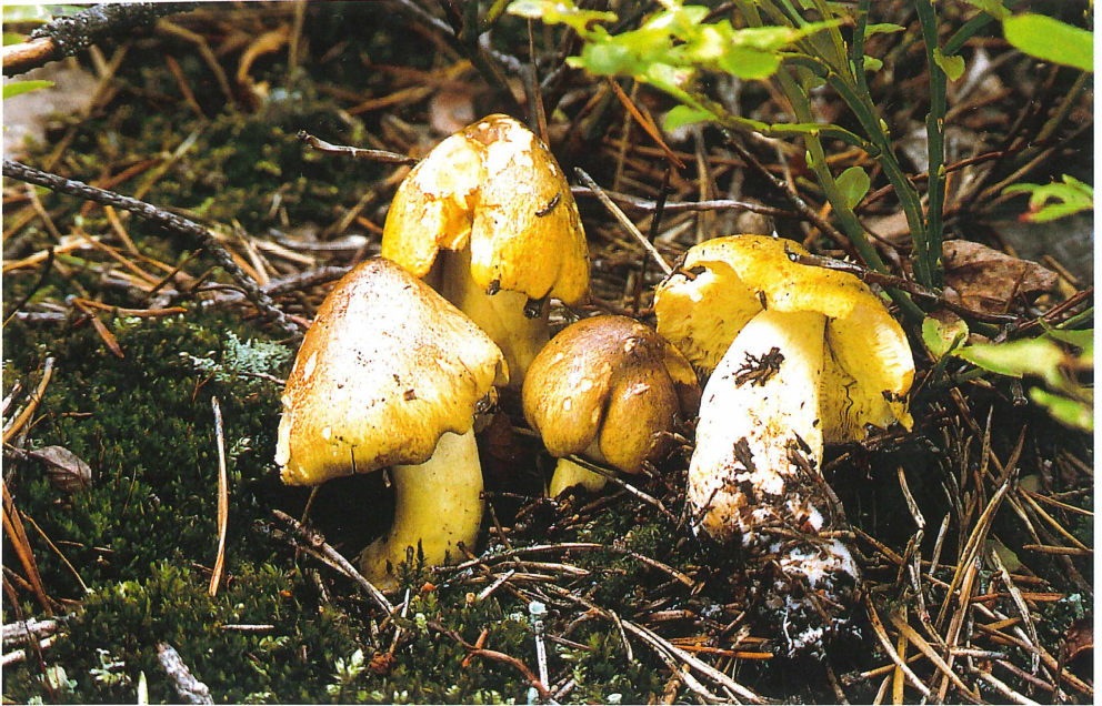
Abb. 1: Tricholoma aestuans , 08.09.1985, MTB 6439/1, Lückenrieth