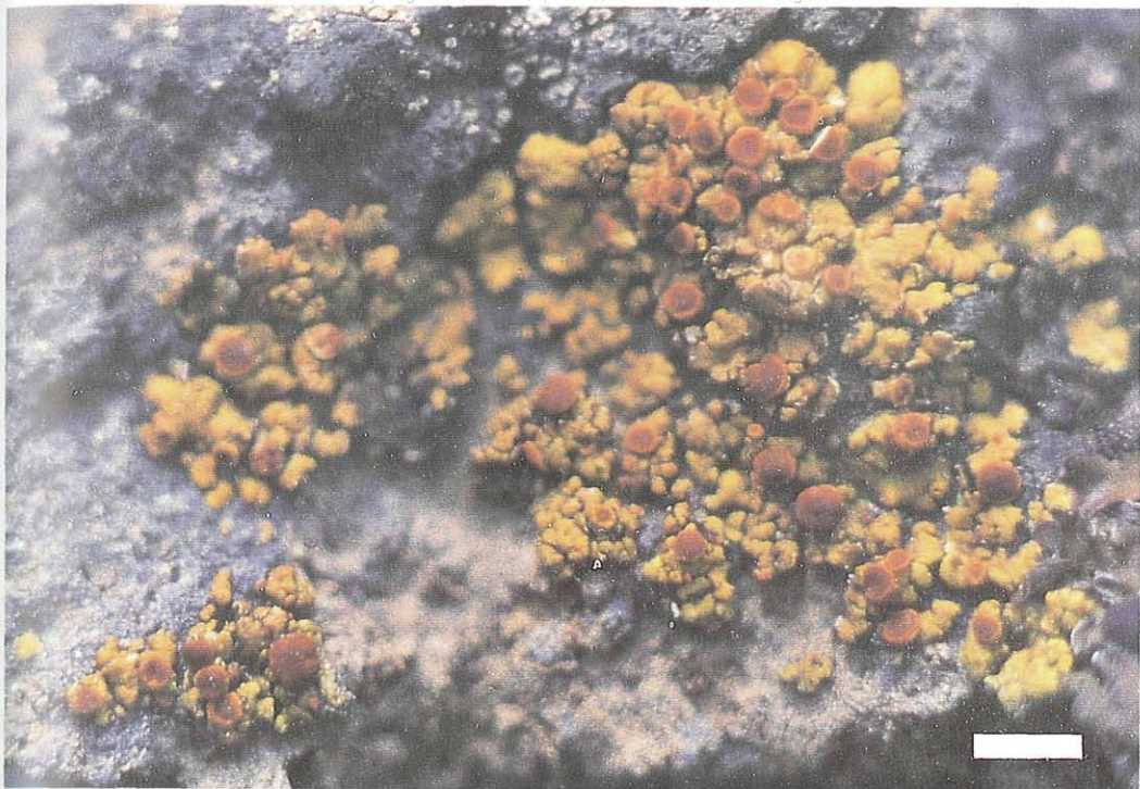
Farbige Abb. XII. Caloplaca canariensis . Habitus: BREUSS 3580, Maßstab = 2,5 mm.