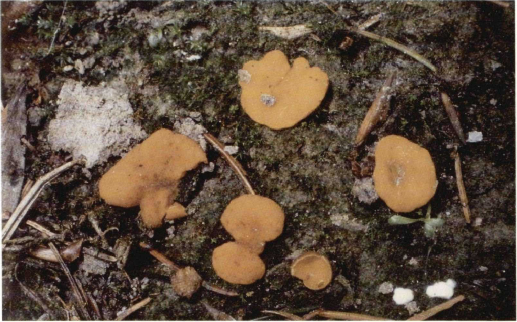
Abb. 2. Koelabaea delectans , Deutschland, Burghausen-Raitenhaslach.