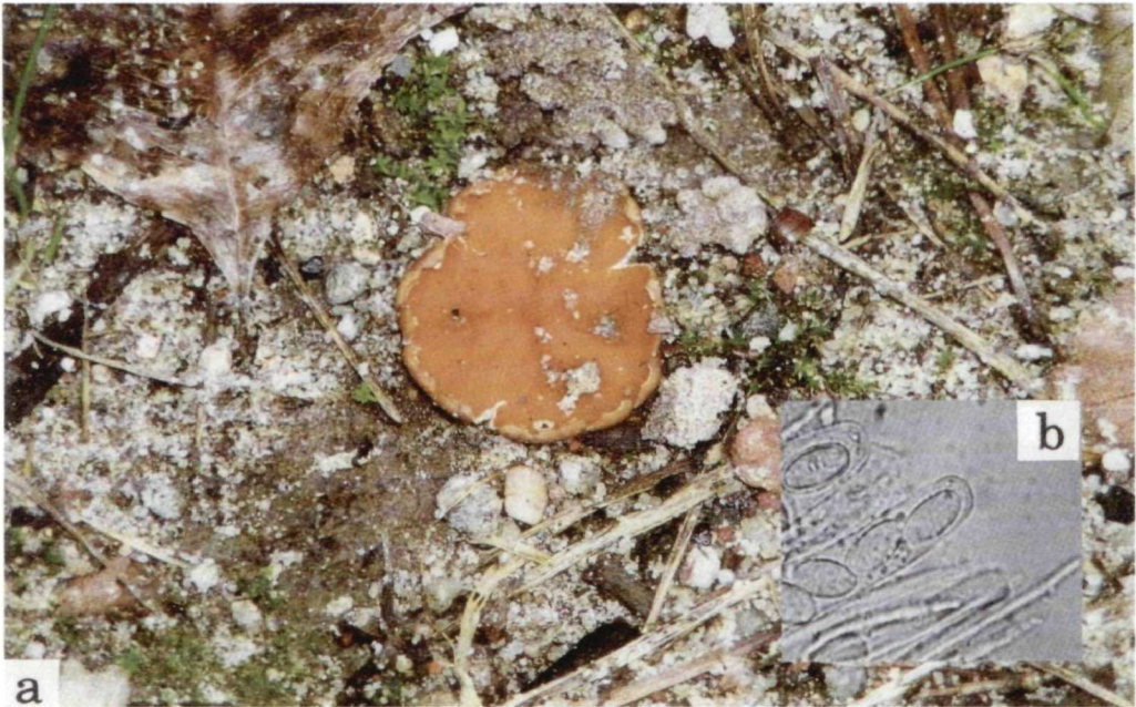
Abb. 3. Koelabaea delectans . a Habitus, b Sporen. Deutschland, Potsdamer Forst.