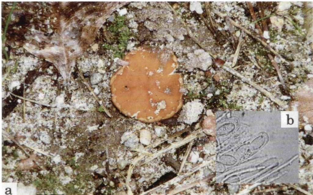
Abb. 3. Kotlabaea delectans . a Habitus, b Sporen. Deutschland, Potsdamer Forst.