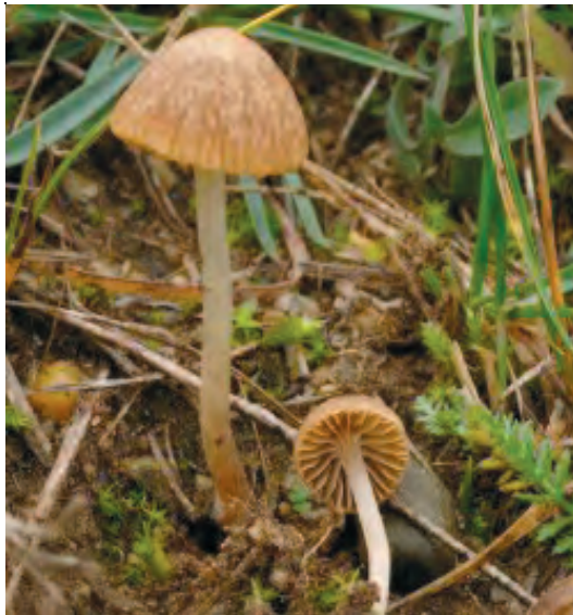
Abb. 3. Psathyrella calcarea (GF 20090134).

KITS VAN WAVEREN (1985) hat Psathyrella calcarea als synonym mit seiner Psathyrella prona var. utriformis KITS v. WAV. betrachtet. Ihm stand ROMAGNESIS Kollektion vom 22. 6. 1968 zur Verfügung, also ausgerechnet diejenige mit den kleinsten, nur bis 13,7 µm langen Sporen (vgl. ROMAGNESI 1975), welche hinlänglich gut in das Konzept von Psathyrella prona var. utriformis passten. Die Synonymisie-