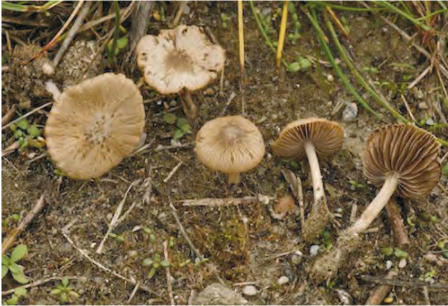
Abb. 2. Psathyrella calcarea (GF 20100009).