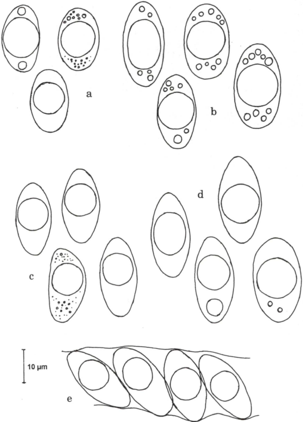
Abb. 2. Sporen 4-sporiger Taxa von Octospora und ihrer 8-sporigen "Schwestersippen". a Octospora crosslandii (Wettin, 12. 2. 77, bei Pterygoneurum ). - b O. itzerottii (Lebus, 26. 3. 93, Holotypus). - c O. leucoloma var. leucoloma (Friesack, 13. 3. 93). - d O. leucoloma var. tetraspora (Frankfurt/Oder, 10. 10. 93). - e O. leucoloma var. leucoloma (Nijmegen, 7. 12. 97); Form mit nur 4 ausreifenden Sporen.