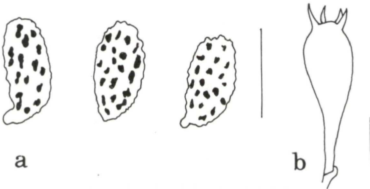
Abb. 2 a, b. Ramaria rubricarnata . a Sporen, b Basidie. Maß: 10 µm.

Untersuchte Kollektion: Österreich: Steiermark, Eichberg-Trautenberg (MTB 9358/2), drei Exemplare in der Laubstreu, bei Eiche, Buche, Hainbuche, 19. 9. 1996, leg. I. KRISAI-GREILHUBER Nr. 7765, det. J. CHRISTAN (WU 19300).