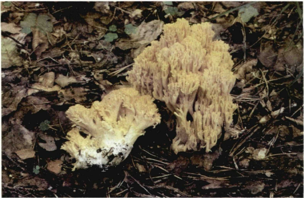
Farbige Abb. XXV. Ramaria rubricarnata (WU 19300).