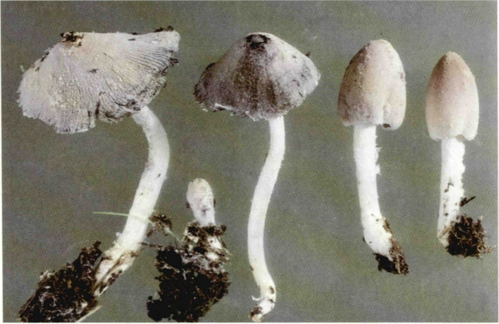
Farbige Abb. XXIV. Coprinus pseudoniveus (WU16909).