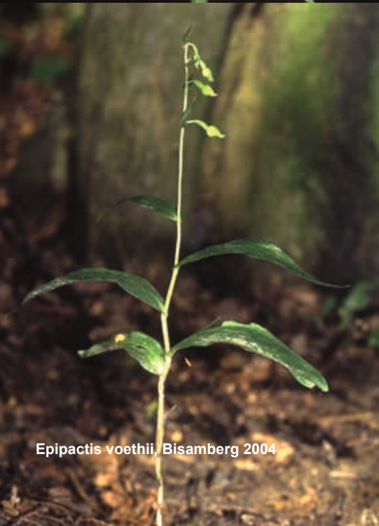
Epipactis voethii , Bisamberg 2004