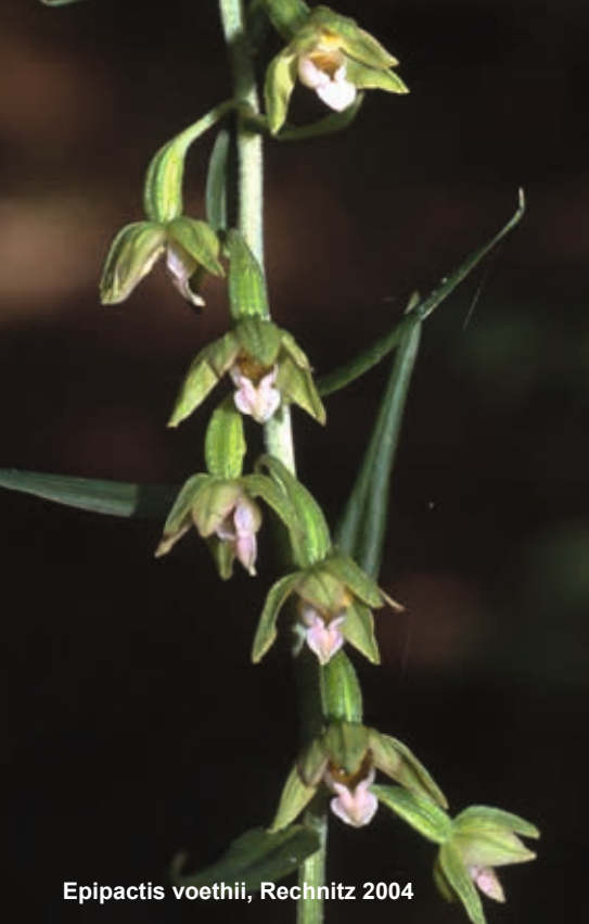
Epipactis voethii , Rechnitz 2004