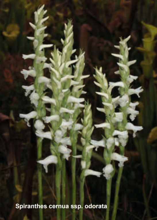
Spiranthes cernua ssp. odorata