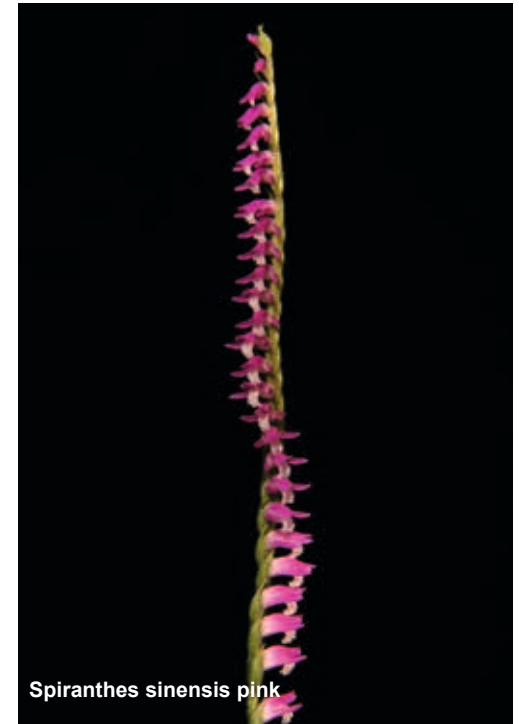
Spiranthes sinensis pink

Leider verlieren Liebhaber immer wieder Pflanzen von Sp. aestivalis , Sp. sinensis oder Sp. romanzoffiana in Kultur durch Verwendung von mineralischen Mischungen. Mit Perlit, Seramis oder Lava etc. hergestellte Substrate sind für Pflanzen dieses Ökotyps jedoch völlig ungeeignet und verursachen