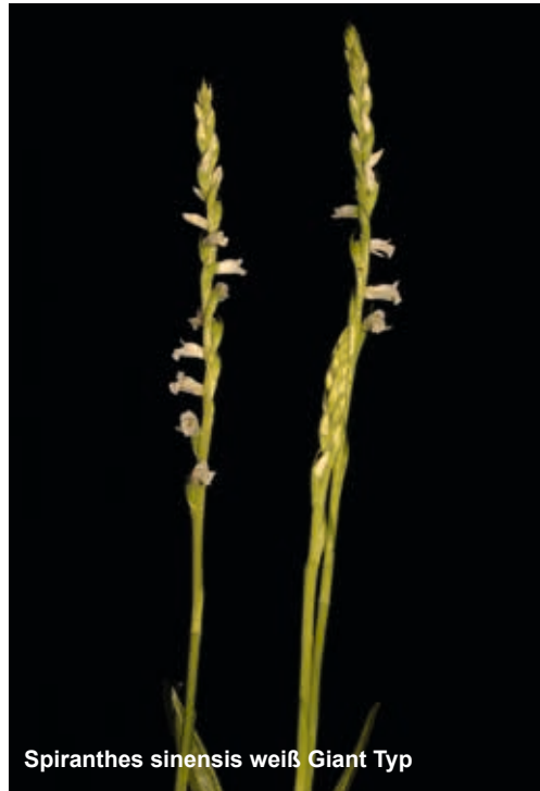
Spiranthes sinensis weiß Giant Typ

Düngung: Die Düngung sollte sehr zurückhaltend durchgeführt werden, da die Pflanzen ohnehin an sehr nährstoffarme Standorte angepasst sind. Mit gezielter Düngung kann die vegetative Vermehrung und die Ausbildung größerer Neutriebe gefördert werden, gleichzeitig steigt mit einem Übermaß aber die Mortalität. Dies sollte jeder Liebhaber abschätzen, wenn er z. B. so wertvolle Arten wie Sp. aestivalis kultiviert! Handelsüblicher Dünger mit reduziertem Stickstoffanteil kann verwendet werden. Die Düngergaben sollten 14-tägig mit einer Konzentration unter 200µS/cm erfolgen.