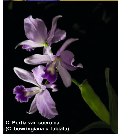
C. Portia var. coerulea (C. bowringiana x C. labiata)

Verwendung fand hierbei Phalaenopsis violacea var. coerulea. So ist die in diesem Artikel abgebildete Doritaenopsis Purple Martin eine Hybride aus Doritaenopsis Kenneth Schubert var. coerulea, nochmals zurückgekreuzt auf Phalaenopsis violacea var. coerulea. Doritaenopsis Kenneth Schubert var. coerulea selbst ist eine Kreuzung aus Doritis pulcherrima var. coerulea mit Phalaenopsis violacea var. coerulea. Die Hybride mit den Normalformen dieser beiden Orchideen wurde übrigens schon in den 60er-Jahren des vorigen Jahrhunderts durchgeführt.