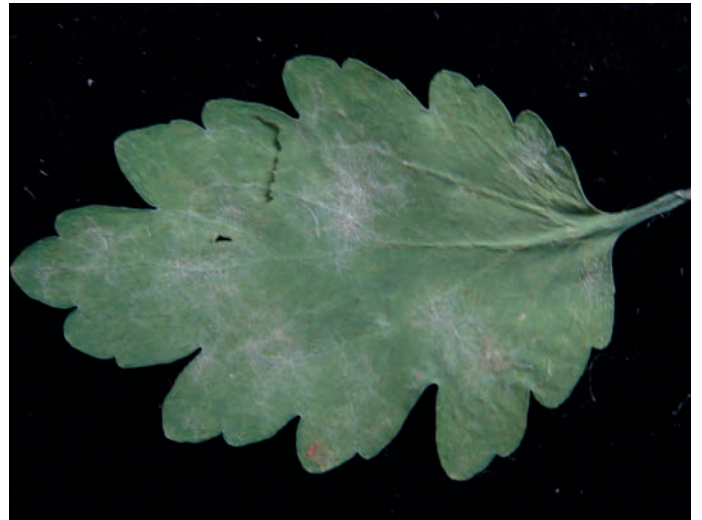
Abb. 8: Erysiphe macleayae an Chelidonium majus .

Fundort: KGV Aspernallee, Wien 2 (N 48°11'50'', O 16°26'36''), 14.05.2018, leg. et det. G. BEDLAN