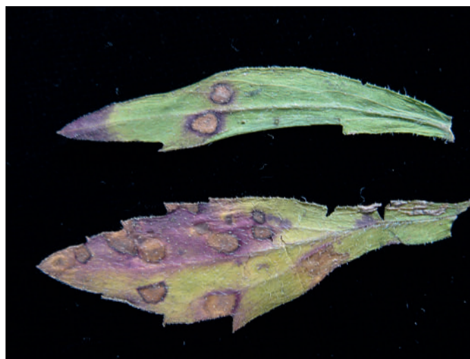
Abb. 1: Septoria erigerontis Blattflecken an Conyza canadensis .

Das Kanadische Berufkraut, Conyza canadensis , wurde etwa 1700 aus Nordamerika nach Europa eingeschleppt. Heu-