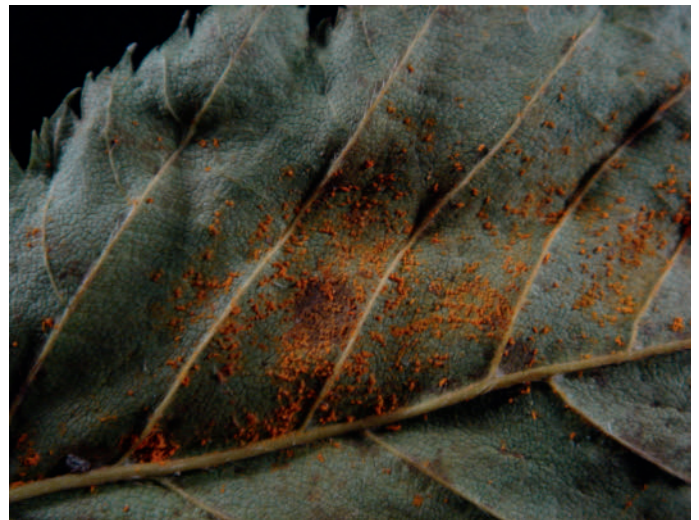
Abb. 5: Melampsorium carpini an Carpinus betulus .

Es ist dies der Erstdnachweis an einer neuen Wirtspflanze: Laburnum anagyroides (Goldregen).