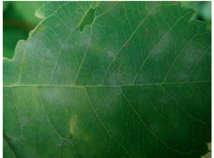
Abb. 9: Podosphaera amelanchieris an Amelanchier lamarckii .

Fundort: KGV „Zur Zukunft“ auf der Schmelz, Wien 15 (N 48°12'06'', O 16°19'24''), 05.08.2018, leg. et det. G. BEDLAN