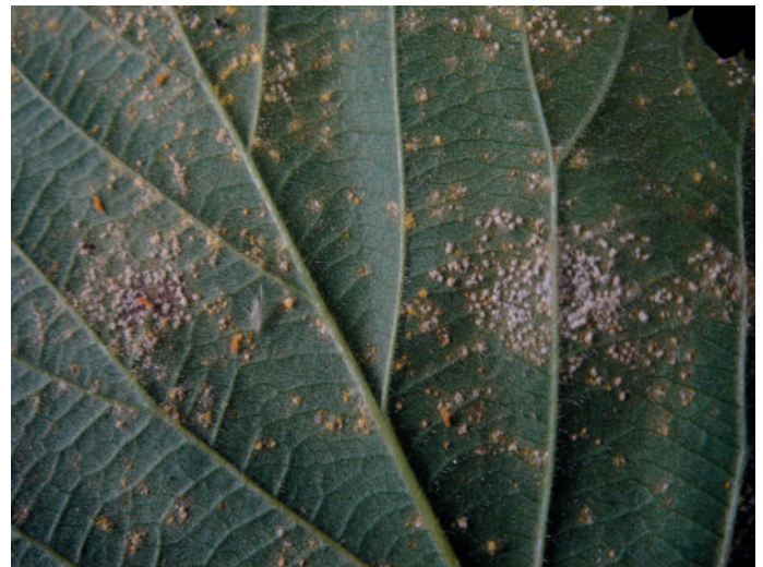
Abb. 3: Teleutosporensori von Kuehneola uredinis an Rubus sp.