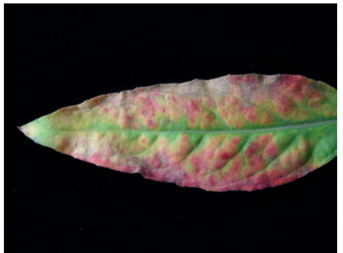
Abb. 10: Erysiphe howeana an Oenothera biennis .

Fundort: KGV „Zur Zukunft“ auf der Schmelz, Wien 15 (N 48°12'06'', O 16°19'24''), 29.09.2016, leg. et det. G. BEDLAN