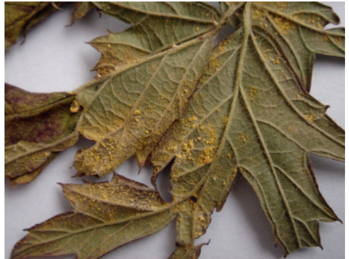
Abb. 2: Kuehneola uredinis an Rubus laciniatus .

Die Flecken sind mit einer dünnen, dunkelbraunen, bis schwarzen Linie umrandet, die wiederum von einer rötlichen Verfärbung des Blattes umgeben ist. Diese reicht verwaschen