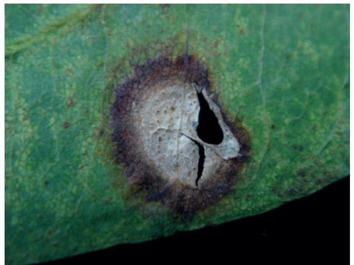
Abb. 7: Ascochyta cytisi Blattflecken an Laburnum anagyroides .