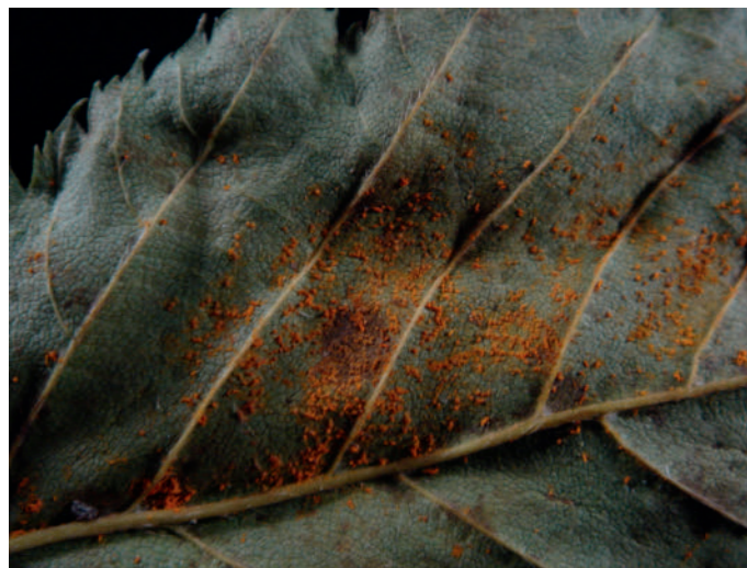
Abb. 5: Melampsorium carpini an Carpinus betulus .

Es ist dies der Erstdnachweis an einer neuen Wirtspflanze: Laburnum anagyroides (Goldregen).