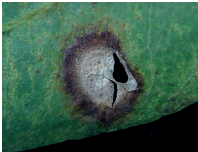
Abb. 7: Ascochyta cytisi Blattflecken an Laburnum anagyroides .