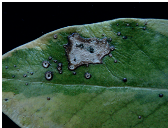
Abb. 6: Phyllosticta terminalis Blattflecken an Ilex sp.