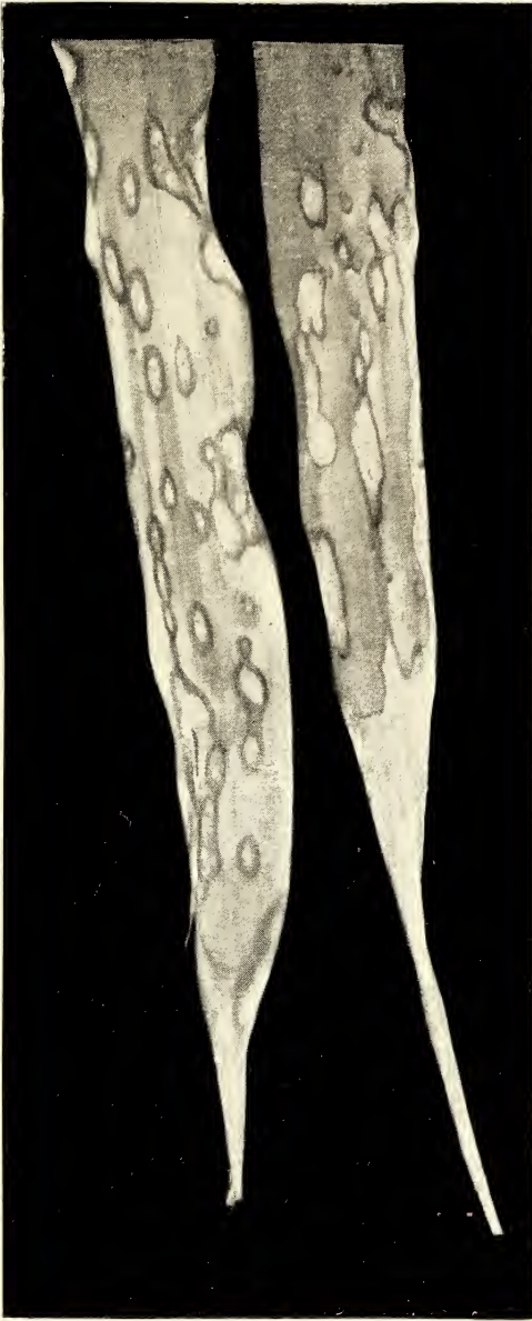
Coniothyrium concentricum Sacc. Auf Yucca filamentosa L.