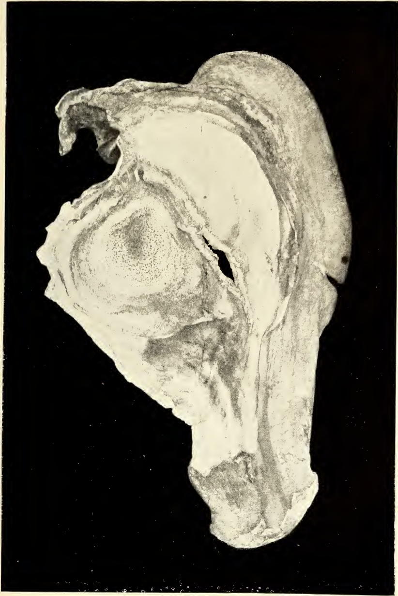
Ascochyta Cotyledonis n. spec. Auf Cotyledon gibbiflorum Moç. et Sess.