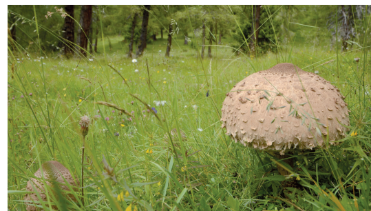
Abb. 4: Riesen-schirmling ( Macrolepiota procera ) in den Eulenwiesen (UR 2).

licher, Einblick in die vorhandene Pilzvielfalt. Die vorliegende Artenliste verschafft also einen guten ersten Eindruck, mit vielen der häufigeren, standorttypischen und/oder auffälligen Arten. Zu den bemerkenswerten Funden zählen Gastrum minimum (leg. Pagitz & Lechner-Pagitz) mit bisher zwei Einträgen für Tirol und Spathularia neesii mit einem knappen Dutzend Fundorten in Österreich laut der Datenbank der Pilze Österreichs ( http://austria.mykodata.net/ ). Ebenso erwähnenswert als Indikatoren für nährstoffarme „Wiesen“ und immer wieder schön: drei Arten von Saftlingen.