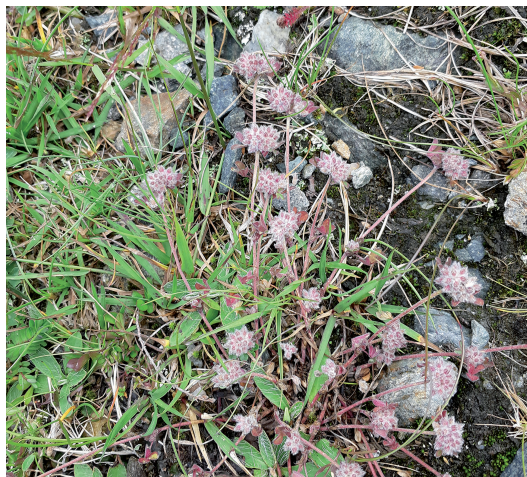
Abb. 5: Felsen-Klee ( Trifolium saxatile ).

Highlights der Tiroler Flora zählen. Sie stammen von außerhalb der drei ausgewiesenen Untersuchungsräume, aus dem Bereich Oberriss (UR 4 in Tabelle 8, Trifolium saxatile 47°5'56"N 11°11'50"E).