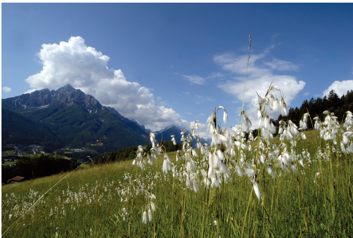
Abb. 1: Telfer Wiesen.