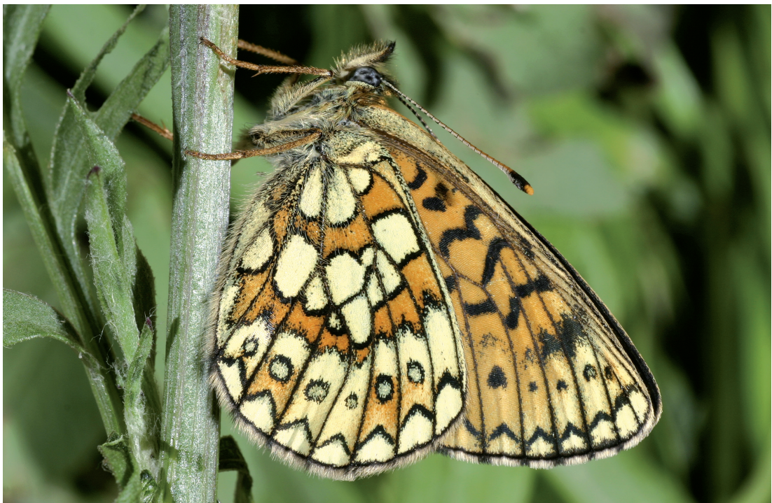
Abb. 3: Der Rändring-Perlmutterfalter ist eine der Top-Raritäten der Telfer Wiesen.