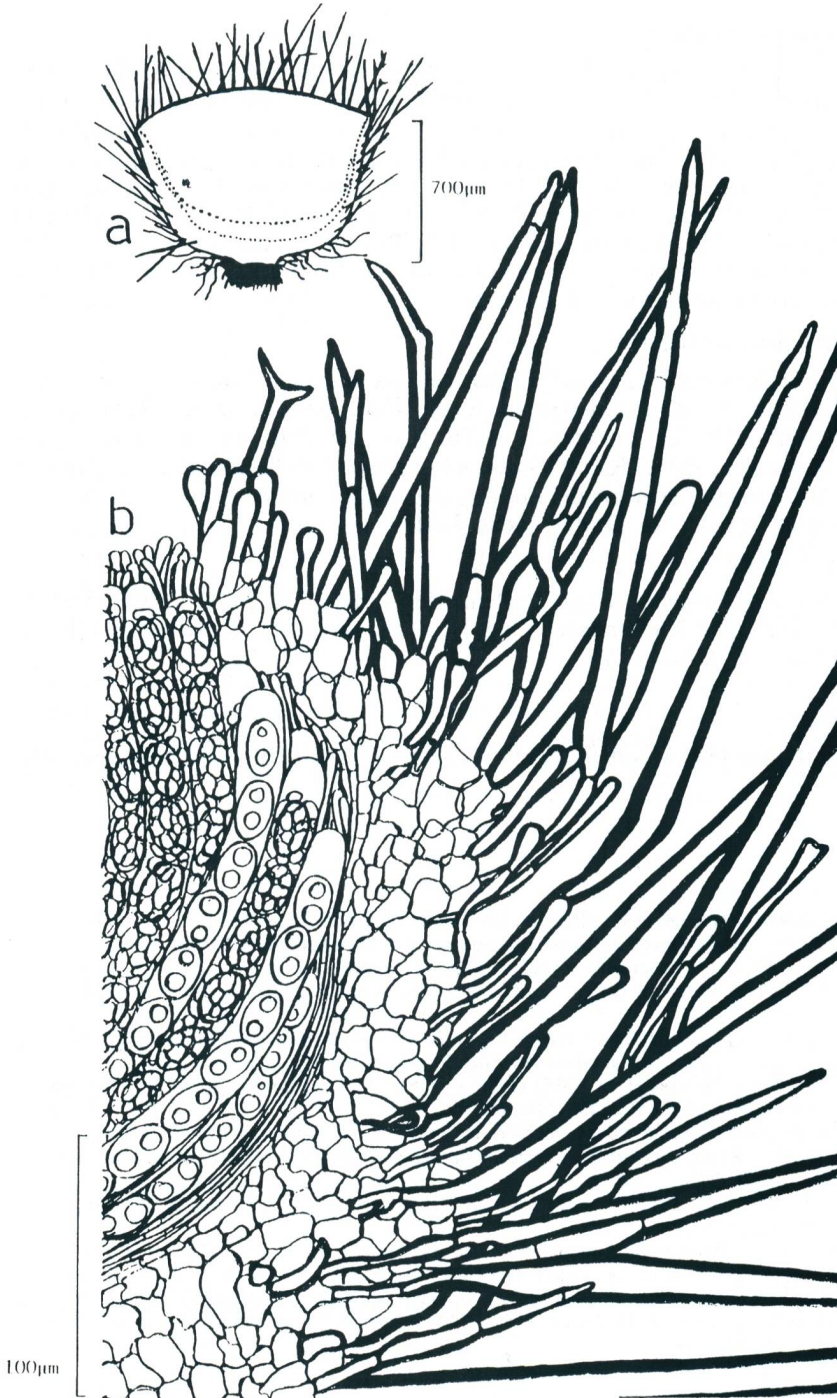
Fig. 1: T. paludosa var. tuberculata – Apothecienschnitt (schematisch; mit Basalfilz und angedeutetem Stielchen, Schichtung: Äuß. Excip., medullärer Teil, Hymen.) b – Randschnitt (Randseten: diverse Formen, septiert bis unseptiert, basale Verankerung im Äuß. Exc.; Tectura angularis des Äuß. Excip.; Paraphysen; Asci mit Ascussporen).