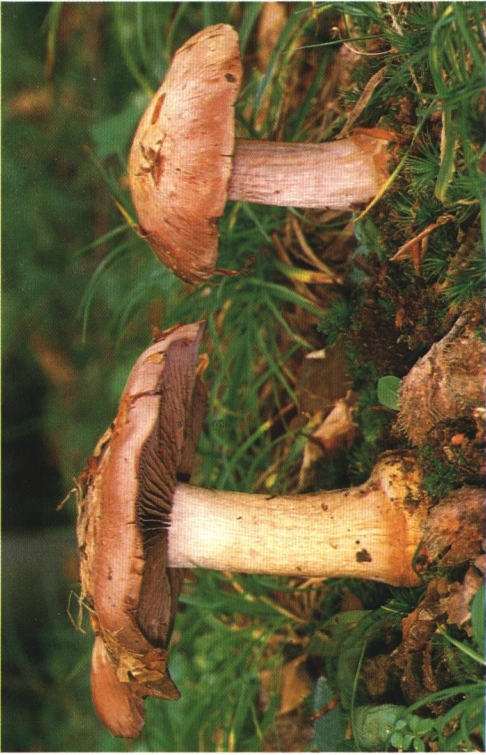
Farbabb. 1: Cortinarius caesiogriseus