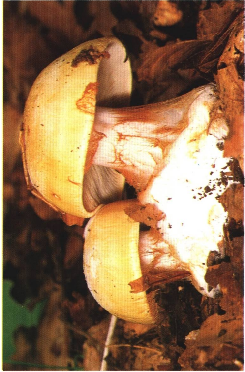
Farbabb. 3: Cortinarius talus