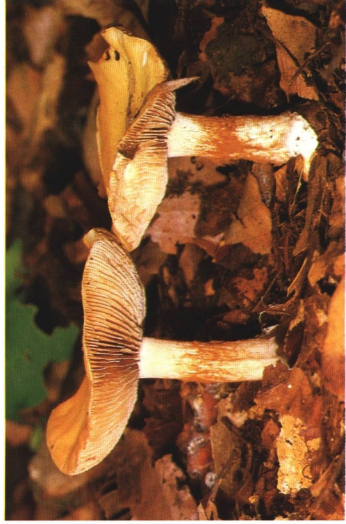
Farbabb. 4: Cortinarius gracilior