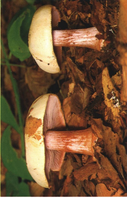
Farbabb. 2: Cortinarius suaveolens