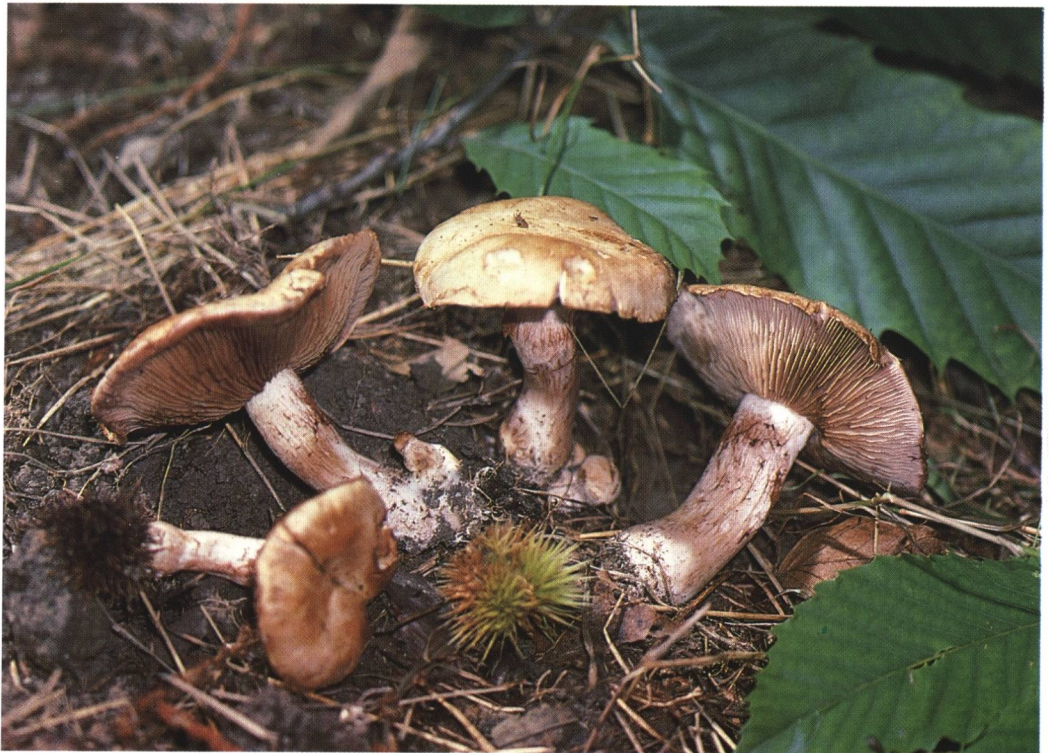
Abb. 1: Cortinarius coalescens , junge Fruchtkörper. Fund im September 1987. Taunus, Kronberger Edelkastanienhain, Gemarkung „Schwarzwald“.