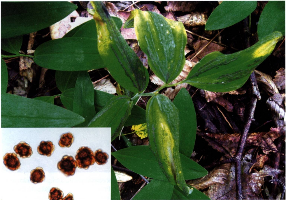
Abb. 3: Urocystis miyabeana auf Polygonatum multiflorum in einem Auwald bei Freckleben am 1.6.2002, die streifenförmigen dunklen Sori in den Blättern sind deutlich erkennbar. Links unten: Mikroaufnahme der Brandsporen.