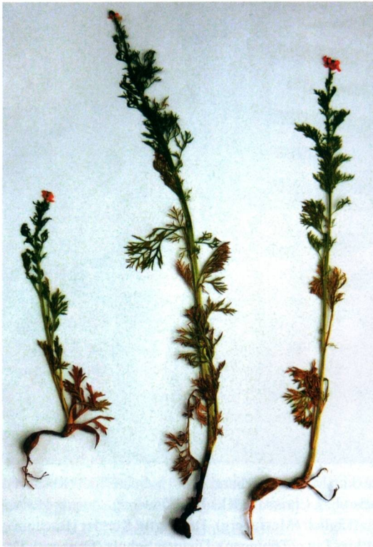
Abb. 10: Urocystis leimbachii auf Adonis aestivalis an den Schmoner Hängen bei Grockstädt am 9.5.2009, hier wurden die Sori nur am Übergang zum Wurzelbereich der Pflanzen festgestellt.

Puccinia galanthi Unger, vgl. JAGE et al. 2007, 2008); U. primulae (Rostr.) Vánky auf Primula veris ; U. syncocca (L. A. Kirchn.) B. Lindeb. auf Hepatica nobilis – alle genannten Pilze im NSG „Schmoner Hänge“ NO Grockstädt auf Muschelkalkhängen der Querfurter Platte, 4835/41; die beiden zuletzt aufgeführten Pilze auch im NSG „Tote Täler“ W Großwilsdorf, 4836/12 – dort wurde auch Ustilago striiformis auf Helictotrichon pubescens beobachtet (Wirt neu für Sachsen-Anhalt).