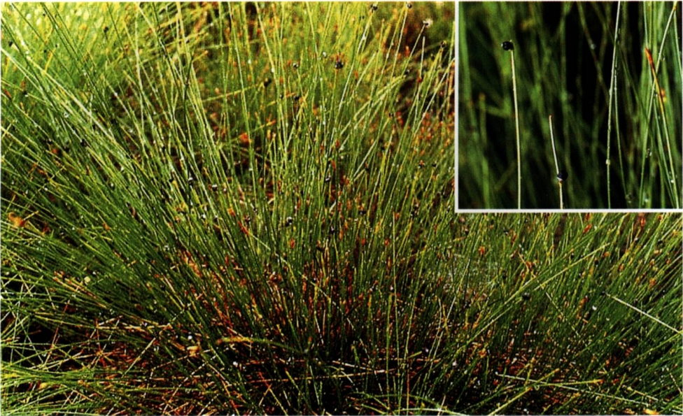
Abb. 5: Anthracoidea scirpi auf Trichophorum cespitosum subsp. cespitosum im Königsberger Moor im Brockengebiet am 26.7.2003, außergewöhnlich stark befallene Pflanze.