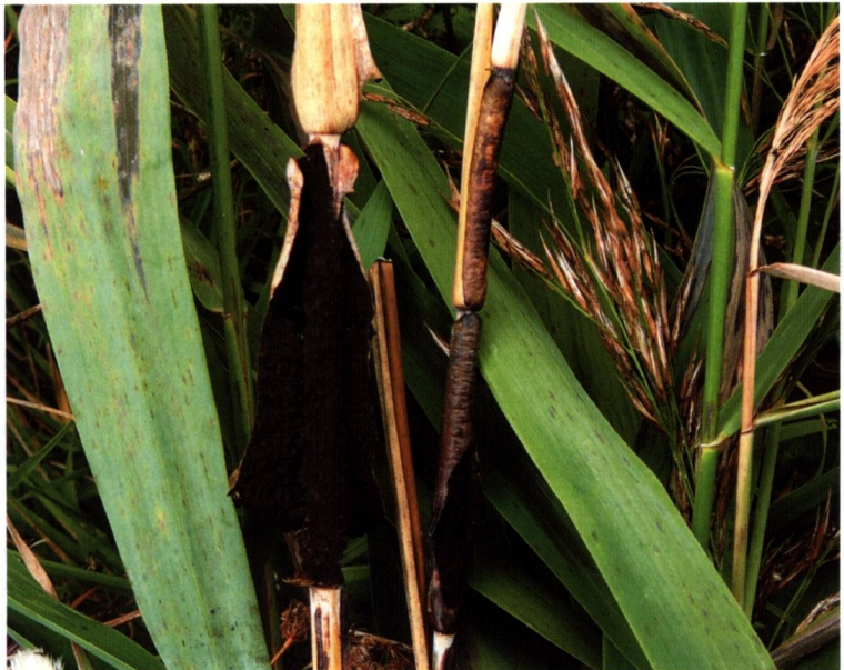
Abb. 4: Ustilago grandis auf Phragmites australis am Bindersee bei Seeburg am 1.6.2002, die befallenen Stellen werden bis 20 cm lang.