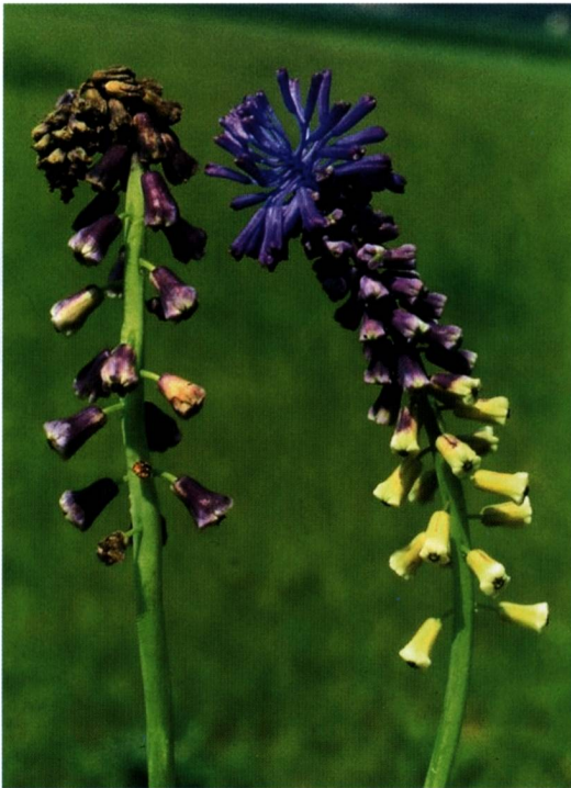
Abb. 2: Antherospora vaillantii auf Muscari tenuiflorum vom Schiedsberg bei Lobejün am 31.5.2002, links der mit dem Brandpilz befallene Blütenstand.