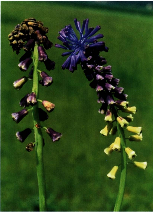
Abb. 2: Antherospora vaillantii auf Muscari tenuiflorum vom Schiedsberg bei Lobejün am 31.5.2002, links der mit dem Brandpilz befallene Blütenstand.