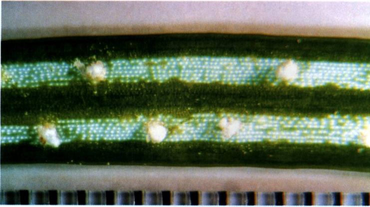
Abb. 6: Aecidium pseudocolumnare auf der Unterseite der Jungwuchsnadeln von Abies alba in der Nähe der Waltersdorfer Mühle im Polenztal am 8.7.2005.

Oberlausitzer Heide- und Teichgebiet nördlich von Görlitz, dort mit Unterstützung von F. Klenke, ausgewählt.