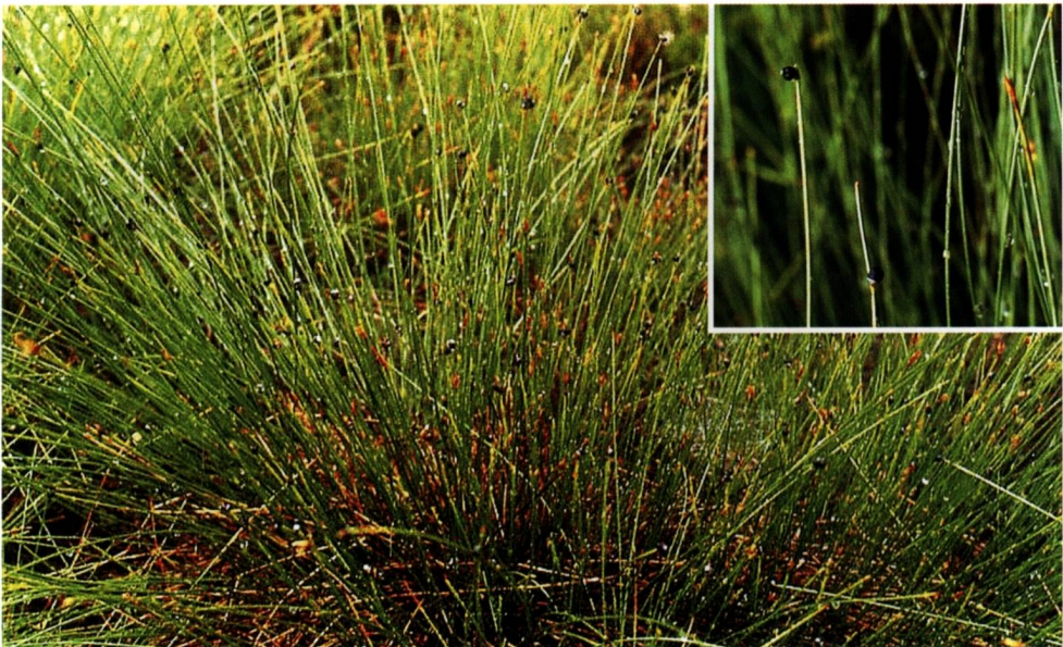
Abb. 5: Anthracoidea scirpi auf Trichophorum cespitosum subsp. cespitosum im Königsberger Moor im Brockengebiet am 26.7.2003, außergewöhnlich stark befallene Pflanze.