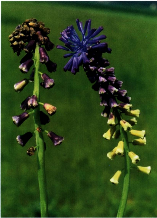
Abb. 2: Antherospora vaillantii auf Muscari tenuiflorum vom Schiedsberg bei Lobejün am 31.5.2002, links der mit dem Brandpilz befallene Blütenstand.