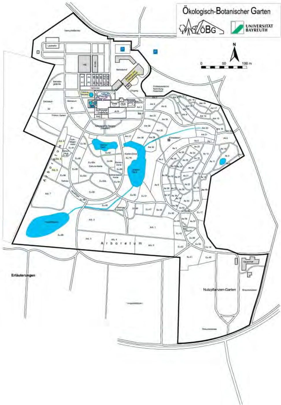
Abb. 1: Lageplan des ÖBG Bayreuth mit Quartieren