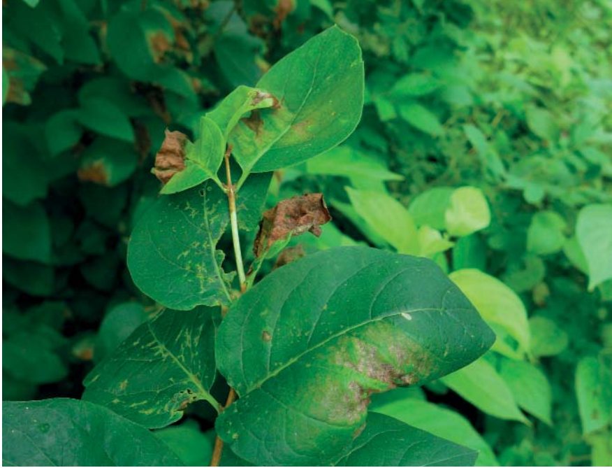
a) - c) Insolibasidium deformans auf Lonicera spec. a) Befallene Sprosse.