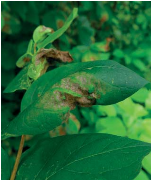
b) Hellgrüne Auftreibungen der Blätter.