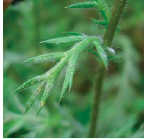
b) Schwacher Befall der Blätter mit weißem Myzel

a) - b) Golovinomyces macrocarpus auf Chamaemelum nobile . a) Weißes Myzel auf blühenden Pflanzen