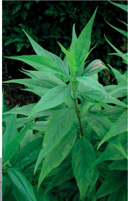
b) - c) Erysiphe elevata auf Chitalpa tashkentensis . b) Anhängsel der Chasmothecien schlaff und lang, an den Enden verzweigt, c) Weißes Myzel und Chasmothecien als schwacher Befall blatt- toberseits.