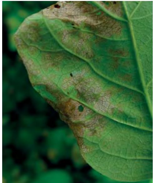
c) Weißer kompakter Basidienrasen auf der Blattunterseite.