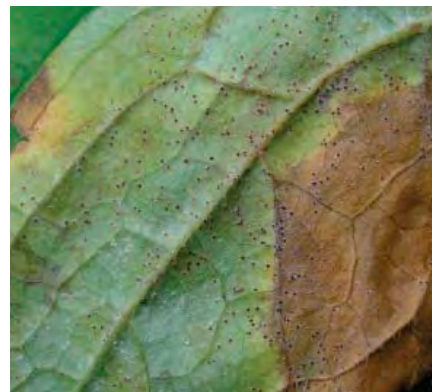
d) Zahlreiche Chasmothecien auf der Blattunterseite ausgebildet

c) - d) Neoerysiphe geranii auf Geranium nodosum . c) Relativ schwaches Myzel, vor allem blattoberseits ausgebildet