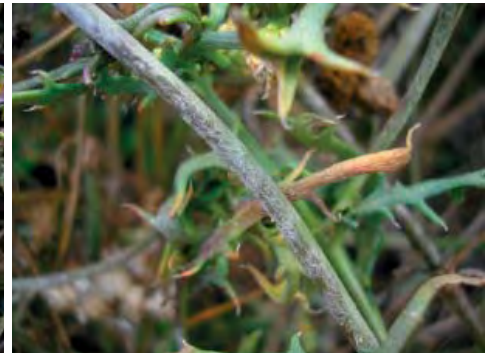
d) - e) Golovinomyces spec. auf Lonas annua . d) Weißes Myzel auf blühenden Pflanzen, e) Dichtes Myzel an den Stängeln. Enden verzweigt.