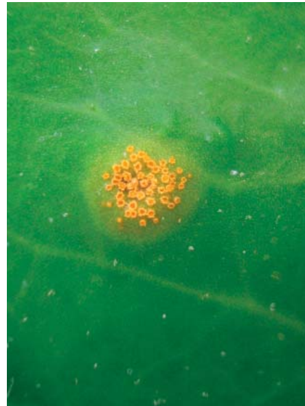
c) - d) Puccinia lagenophorae auf Emilia coccinea . c) Die Wirtspflanze ist leicht kenntlich durch die feuerroten Blüten