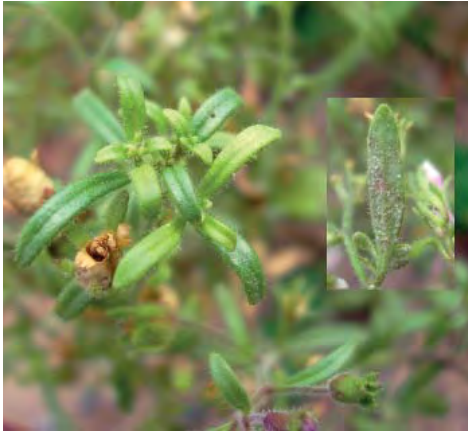
a) Junge befallene Triebspitzen und gräulicher Rasen auf Chaenorhinum minus , hervorgerufen durch den Befall mit Peronospora linariae