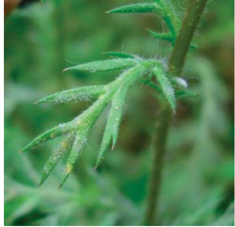
b) Schwacher Befall der Blätter mit weißem Myzel

a) - b) Golovinomyces macrocarpus auf Chamaemelum nobile . a) Weißes Myzel auf blühenden Pflanzen