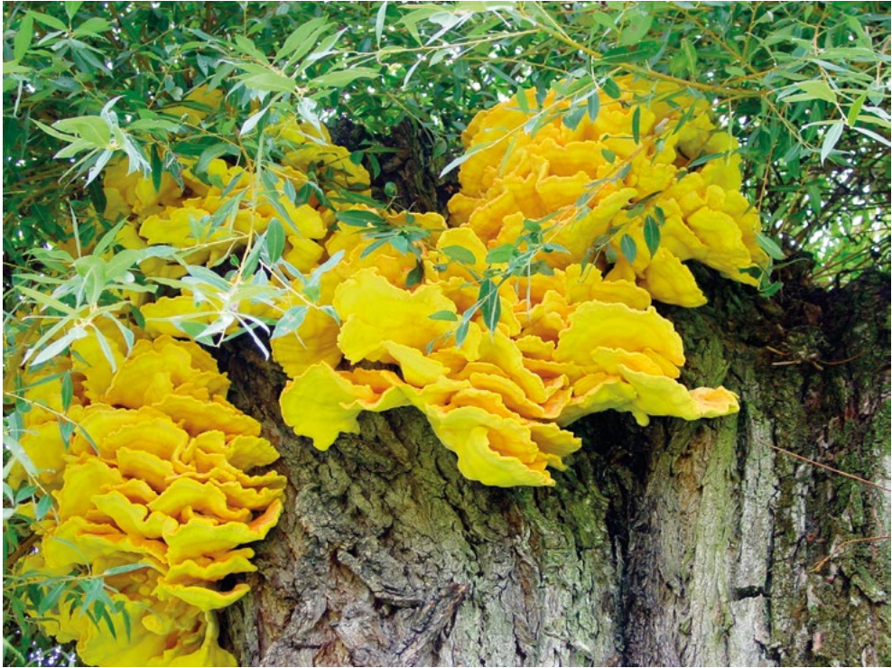
Abb. 3: Zahlreiche gelbe Fruchtkörper vom Schwefelporling ( Laetiporus sulphureus ) im oberen Stammbereich.