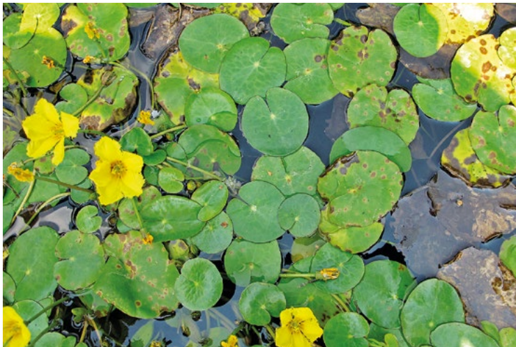
Abb. 14: Der selten berichtete asexuelle Pilz Septoria villarsiae parasitiert auf Blättern der Seekanne ( Nymphoides peltata ) und verursacht charakteristische braune Blattflecken.

Eine ziemlich selten berichtete Art ist Septoria villarsiae (Abb. 14). Der Pilz parasitiert auf Blättern der Seekanne ( Nymphoides peltata ), die zu den Fiebertree-Gewächsen gehört, und stehende Gewässer sowie seeähnliche Altwasser von Flüssen besiedelt. In der Literatur gibt es Hinweise (FARR & ROSSMANN 2018), dass auch andere nah verwandte Menyanthaceae befallen werden. Der in dieser Arbeit gelistete Fund der Zweitautorin aus 2013 ist der einzige neue Nachweis für Hessen in „Pilze Deutschlands“ (DGfM-DATENBANK 2018), ein dort nicht gelisteter Nachweis vor 1864 aus Hatzenheim im Rheingau stammt von FÜCKEL (1864). Etwa zeitgleich mit dem Fund von FÜCKEL gibt es einen Fundort im Jahre 1894 in Straubing in den Donauauen (GBIF.ORG 2018), drei Funde in Berlin (nach DIEDICKE 1912-15), sowie 1957 aus Hamburg (GBIF.ORG 2018). Der zweite Nachweis in Pilze Deutschlands (DGfM-DATENBANK 2018) in neuerer Zeit stammt von der Erstautorin (Rheine, Nordrhein-Westfalen, 2017). Zwei weitere Funde werden aus Sachsen-Anhalt (JAGE 2016) bzw. aus Brandenburg berichtet (KUMMER 2009). In anderen europäischen Ländern (Belgien, Großbritannien, Niederlande, Österreich, und Rumänien) ist Septoria villarsiae bei GBIF.ORG (2018) mit 9 Fundorten gelistet. Etliche dieser Fundorte liegen in botanischen Gärten bzw. Parks. In Polen wurde der Pilz im botanischen Garten von Krakau gefunden (WOŁCZAŃSKA 2010). In dieser Arbeit wird von einem weiteren Fund in Polen aus dem Jahr 1926 in einer Parkanlage berichtet.