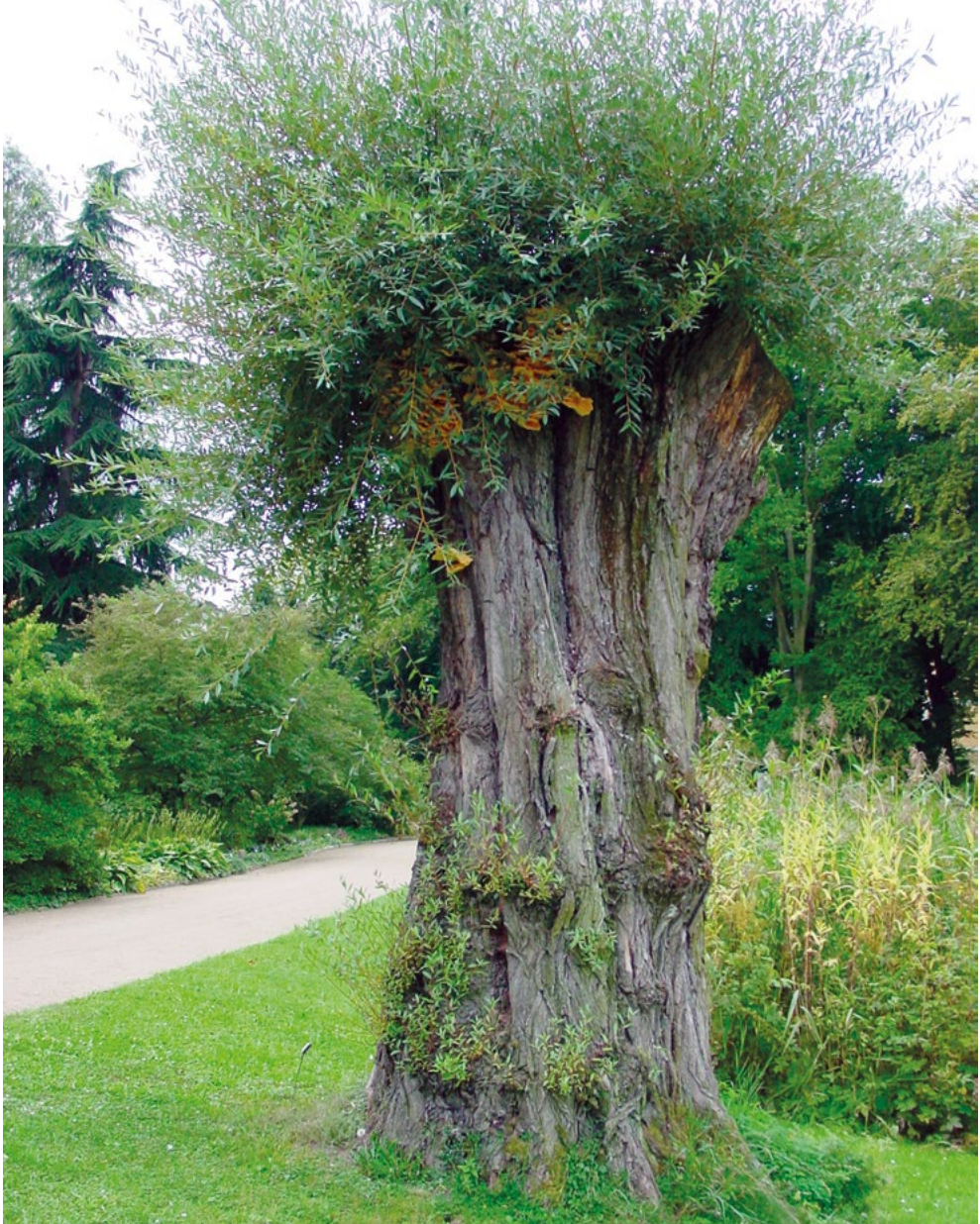
Abb. 2: Schwefelporling ( Laetiporus sulphureus ) auf der Dotterweide ( Salix alba var. vitellina ) am Teich im Botanischen Garten Frankfurt. Die 1950 gepflanzte Weide musste immer wieder zur Verkehrssicherung beschnitten werden und fiel 2012.

Thelephorales (3 Aufsammlungen/3 Arten): Thelephora anthocephala (Bull.) Fr. auf Totholz von Fagus sylvatica L., 1.1, 11.10.2014, Piepenbring M – Thelephora palmata (Scop.) Fr. in der Laubstreu, 1.1, 13.7.2007, Trampe T, HLW TT 284 – Thelephora terrestris Ehrh. auf Holzresten von Fagus sylvatica L., 1.1, 12.10.2013, Sandau H