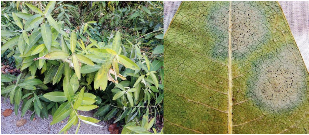
Abb. 8: Phyllactinia fraxini auf Asclepias syriaca , ein Erstnachweis für diese Pilz-Wirt-Kombination in Deutschland. li. Habitus der befallenen Wirtspflanzen, re. kreisrunde Myzelflecken mit gut sichtbaren Fruchtkörpern (Chasmothecien) auf der Unterseite eines Blattes.

Befall ist auf der Blattoberseite ein weißliches Myzel mit zahlreichen darin befindlichen kleinen und dunklen Fruchtkörpern ausgebildet (Abb. 9).