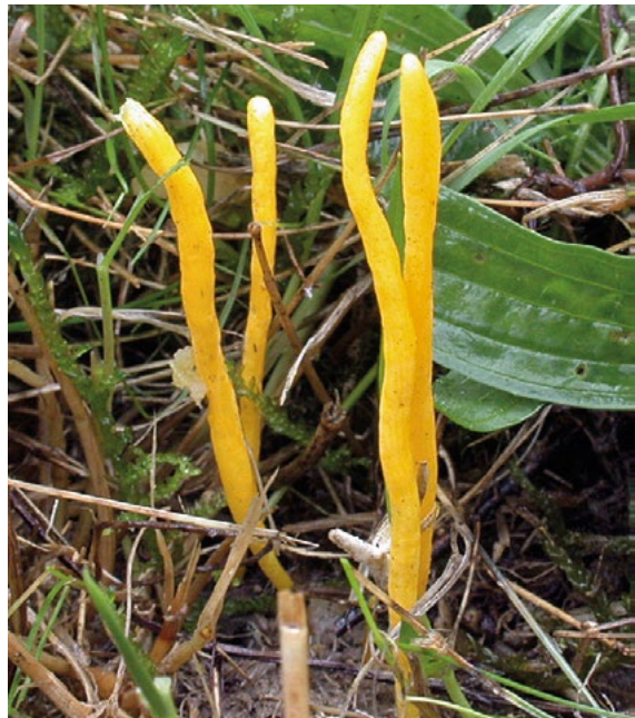
Abb. 5: Die Goldgelbe Wiesenkeule ( Clavulinopsis helvola ).

Im Zeitraum August 2010 bis Dezember 2018 wurden drei Großpilzarten registriert, die in der aktuellen Roten Liste der Großpilze als gefährdet gekennzeichnet sind (DÄMMRICH et al. 2016). Zu den in ganz Deutschland wegen Standortverlust und Eutrophierung bedrohten Wiesenpilzen der CHEG-Gruppe ( Clavariaceae-Hygrocybe-Entoloma-Geoglossaceae ) gehört die Goldgelbe Wiesenkeule Clavulinopsis helvola (Abb. 5). Mit der Rote-Liste-Kategorie „3“ gilt sie als gefährdet. Auch wenn die Art noch als „mäßig häufig“ eingestuft wird, wurden starke Rückgänge festgestellt, die dem Verlust von Offenland-Biotopen geschuldet sind.