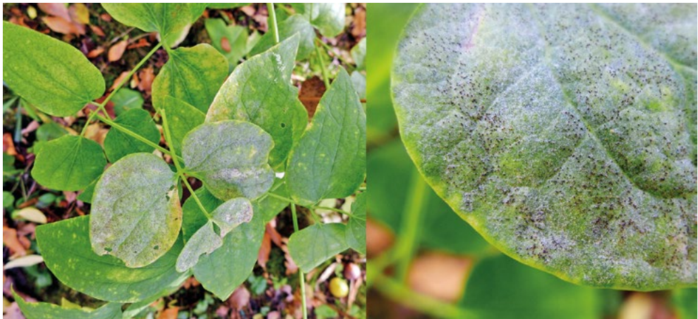
Abb. 9: Weißliches Myzel und zahlreiche kleine dunkle Fruchtkörper von Erysiphe aquilegiae var. ranuoculi auf der Oberseite von Clematis recta -Blättern. li: Habitus, re: Detail der Fruchtkörper.