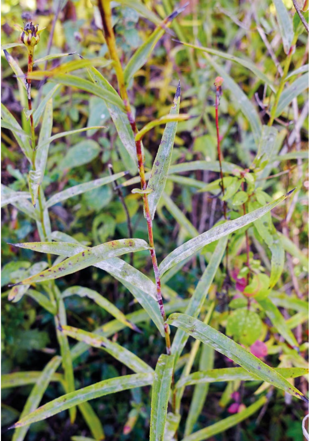
Abb. 10: Weißes Myzel von Golovinomyces inulae auf der Oberseite von Inula ensifolia -Blättern.