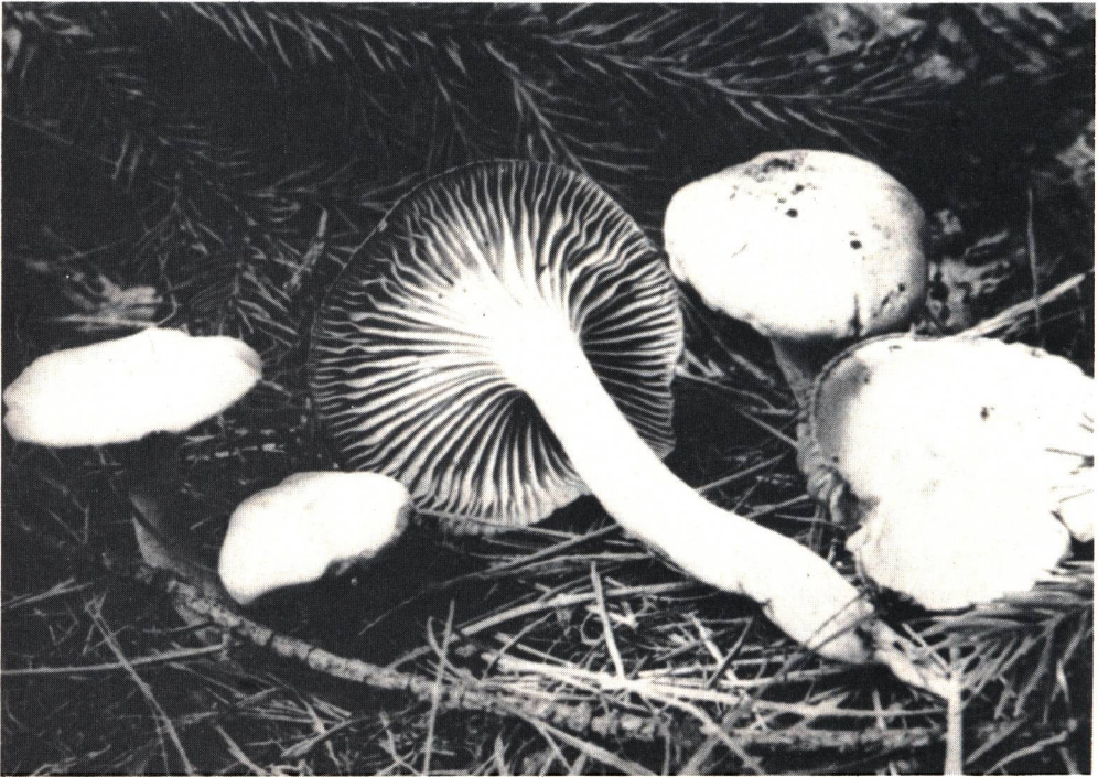
Tafel I. Hygrophorus karstenii . Fruchtkörper x 1.