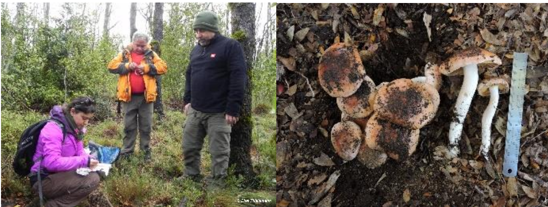
Figura 3. Recolección de cuerpos fructíferos en terreno y demostración del procedimiento adecuado para obtener una fotografía científica para Cortinarius sp.

procurando que se registre la mayor información posible en la fotografía, como la forma y color del píleo, estípites, tipo de himenio, presencia o ausencia de anillo, volva, forma de la base, escamas, tipo de lamelas, etc. (Fig. 3). Finalmente, cada especie o morfotipo se guardó cuidadosamente en papel alusa metálico con un código, para luego ser secado en un deshidratador de alimentos a 35° - 40° C, determinado al microscopio óptico, utilizando ciertos reactivos y depositados en un Fungario.