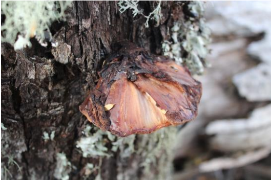
Figura 16. Fistulina antarctica Sp. Especie parásita de N. dombeyi (coigüe) y comestible. Se caracteriza por su basidioma carnoso y viscoso, de tonalidades rojizas, cuyo himenio es poroso y de tonos rosa pálido. Fotografía: Eitel Thielemann.

blanquecino con una superficie escamosa. Su carne es delgada, escasa y frágil. Fotografía: Eitel Thielemann.