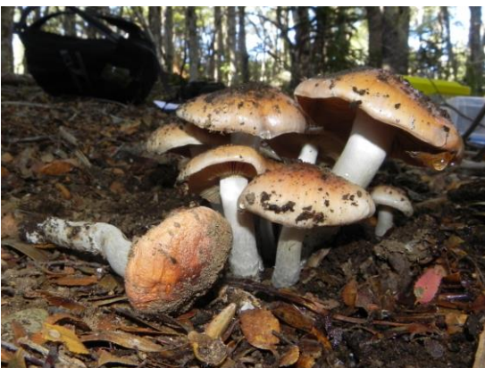
Figura 5. Cortinarius austroturmalis M.M. Moser & E. Horak. Es un hongo comestible poco conocido asociado obligatoriamente a especies de Nothofagus spp. Presenta un píleo de color café en el centro, más

Figura 4. Austropaxillus sp. Especie ectomicorrízica que se caracteriza por sus tonalidades pardas amarillentas-pálidas, cuyo sombrero es infundibuliforme (se curva hacia adentro en el centro), y las lamelas son decurrentes, es decir, se prolongan hacia el pie, adheridas al estípite.