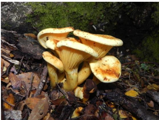
Figura 4. Austropaxillus sp. Especie ectomicorrízica que se caracteriza por sus tonalidades pardas amarillentas-pálidas, cuyo sombrero es infundibuliforme (se curva hacia adentro en el centro), y las lamelas son decurrentes, es decir, se prolongan hacia el pie, adheridas al estípite.

Finalmente, se encontró una especie parásita de Nothofagus dombeyi : Fistulina antarctica .