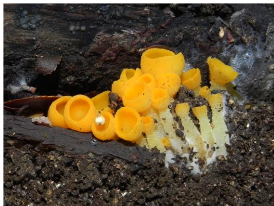
Figura 15. Sowerbyella rhenana (Fuckel) J. Moravec. Tiene forma de copa sobre un estípites con un llamativo color naranja-amarillo. Himenio liso y un pie visible,

Figura 14. Pleurotus ostreatus (Jacq.) P. Kumm. sobre tronco de Araucaria. Píleo de tamaño y color variable, generalmente, suelen ser de colores grises u ocre-grisáceos, láminas decurrentes de color blanquecino y pie corto, totalmente lateral. Es un hongo comestible.