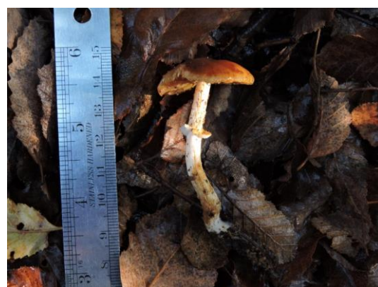
Figura 7. Descolea antarctica Singer. Especie ectomicorrízica que se caracteriza por crecer

Figura 6. Cortinarius pseudotriumphans M.M. Moser & E. Horak. Especie ectomicorrízica que se caracteriza por su gran tamaño en estado maduro, cuyo estípite es blanco y muy escamoso, radicante. Además, su píleo es de color ocre-amarillento.