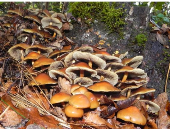
Figura 9. Especie del género Hypholoma , que se caracteriza por ser saprobionte, descomponiendo la madera. El píleo suele

Figura 8. Ramaria flava . Fructificación con forma coraloide, de tonos amarillentos pálidos y bifurcaciones hacia el ápice. Especie comestible de amplio consumo y ectomicorrízica de Nothofagus spp. Su nombre vernacular es "changle".