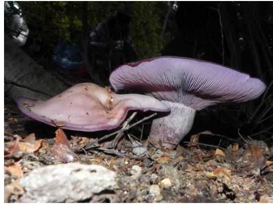
Figura 10. Lepista nuda (Bull.) Cooke. Especie comestible que presenta un píleo generalmente de color azul-violáceo que puede alcanzar un gran tamaño, de forma convexa cuando joven hasta aplanarse cuando maduro con un centro ocráceo. Láminas adnatas y apretadas de color violeta, su estípote es de un color similar. Fotografía: Eitel Thielemann.

ser de tonalidades pardas, y las láminas verde- grisáceas. Se les suele ver en grupos abundantes. Fotografía: Eitel Thielemann.