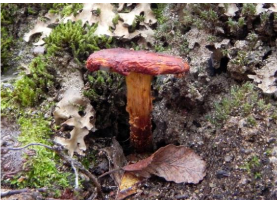
Figura 13. Pholiota sp. Este género se caracteriza por descomponer la madera. Algunas de las especies presentan escamas

Figura 12. Mycena haematopus (Pers.) P. Kumm. Presenta una coloración rosado-rojiza, por la que recibe su nombre específico, con un píleo convexo, acampanado de color pardo-rosa, láminas de color blanquecino y pie concoloro con el píleo. Habitualmente suele crecer en grupos.