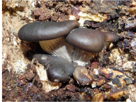
Figura 14. Pleurotus ostreatus (Jacq.) P. Kumm. sobre tronco de Araucaria. Píleo de tamaño y color variable, generalmente, suelen ser de colores grises u ocre-grisáceos, láminas decurrentes de color blanquecino y pie corto, totalmente lateral. Es un hongo comestible. Fotografía: Eitel Thielemann.

tanto en el píleo y estípites, como el ejemplar de la fotografía. Las láminas son pardas pálidas-amarillentas. Fotografía: Eitel Thielemann.