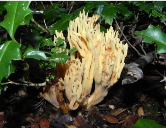
Figura 8. Ramaria flava . Fructificación con forma coraloide, de tonos amarillentos pálidos y bifurcaciones hacia el ápice. Especie comestible de amplio consumo y ectomicorrízica de Nothofagus spp. Su nombre vernacular es "changle".

en el suelo, con un píleo café, glabro, lamelas de tonos similares, estípote blanco y con un anillo. Es frecuente de encontrar en bosques de Nothofagus spp.