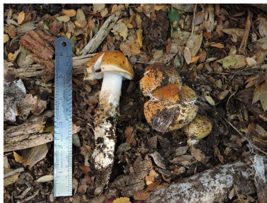
Figura 6. Cortinarius pseudotriumphans M.M. Moser & E. Horak. Especie ectomicorrízica que se caracteriza por su gran tamaño en estado maduro, cuyo estípite es blanco y muy escamoso, radicante. Además, su píleo es de color ocre-amarillento.

blanquecino por los bordes y un estípite liso de color blanco. Crece de manera cespitosa (varios ejemplares juntos).