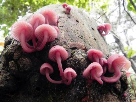
Figura 12. Mycena haematopus (Pers.) P. Kumm. Presenta una coloración rosado-rojiza, por la que recibe su nombre específico, con un píleo convexo, acampanado de color pardo-rosa, láminas de color blanquecino y pie concoloro con el píleo. Habitualmente suele crecer en grupos. Fotografía: Eitel Thielemann.

Láminas y estípites de color blanco, éste último pruinoso con un anillo basal azul oscuro. Suele crecer en colonias, pero también lo hace en solitario. Fotografía: Eitel Thielemann.