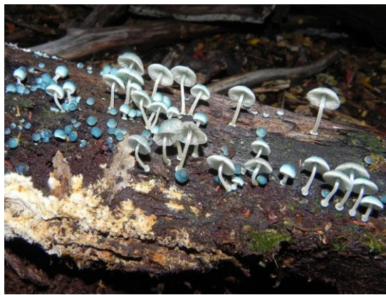
Figura 11. Mycena cyanocephala Singer. Píleo Es convexo a convexo-aplanado de color azul-celeste con el centro más oscuro.

Figura 10. Lepista nuda (Bull.) Cooke. Especie comestible que presenta un píleo generalmente de color azul-violáceo que puede alcanzar un gran tamaño, de forma convexa cuando joven hasta aplanarse cuando maduro con un centro ocráceo. Láminas adnatas y apretadas de color violeta, su estípote es de un color similar.