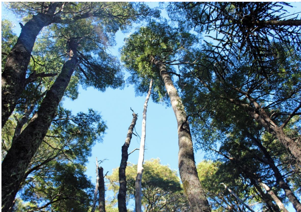
Figura 2. Bosque mixto de Nothofagus dombeyi (Coigüe) y Araucaria araucana (Araucaria).

En otoño del presente año, específicamente en el mes de mayo, se llevó a cabo una excursión micológica dirigida a las partes más altas de la Cordillera de Nahuelbuta (800 – 1300 msnm), donde se encuentran las zonas protegidas de Trongol Alto y Cuesta de Caramávida, donde predominan bosques nativos de Araucaria araucana y de Nothofagus spp. (Fig. 2).